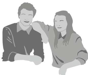
Signalement - Kammeraten

Kammeraten kommer således i første omgang, fordi vedkommende bliver trukket med af en. Hvis man skal fastholde kammeraten, er det vigtigt, at vedkommende får nogle succesoplevelser, som giver lyst til at komme og bakke op om sagen. Det kan fx være oplevelsen af at ens indsats faktisk kan ændre noget og betyder noget. Det handler måske om at vække den unges lyst og gøre aktiviteterne vedkommende.