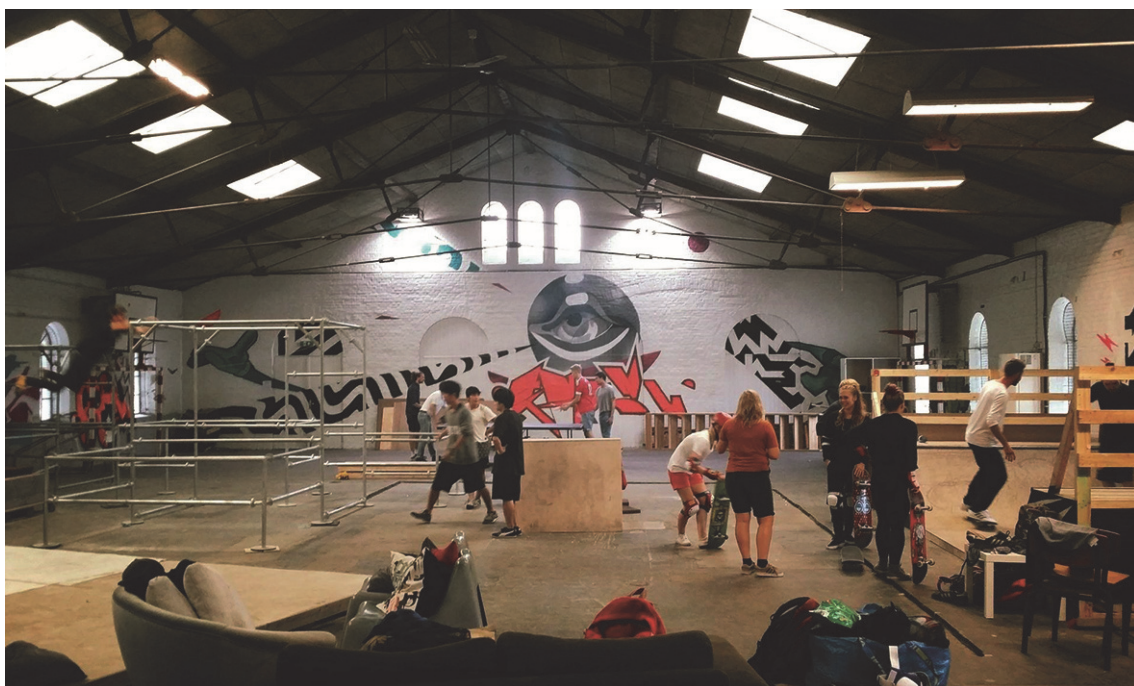
Parkour i Ungdomskulturhusets hal.