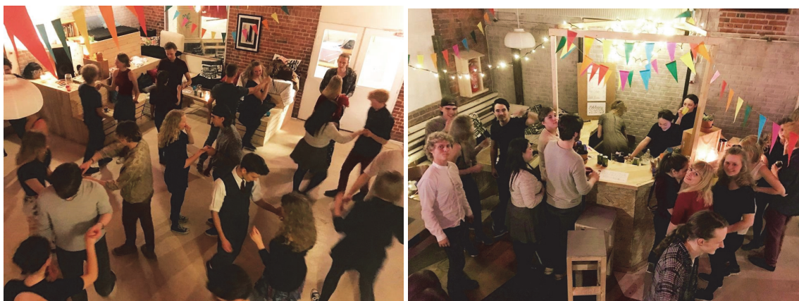
Salsaaften i Ungdomskulturhuset.