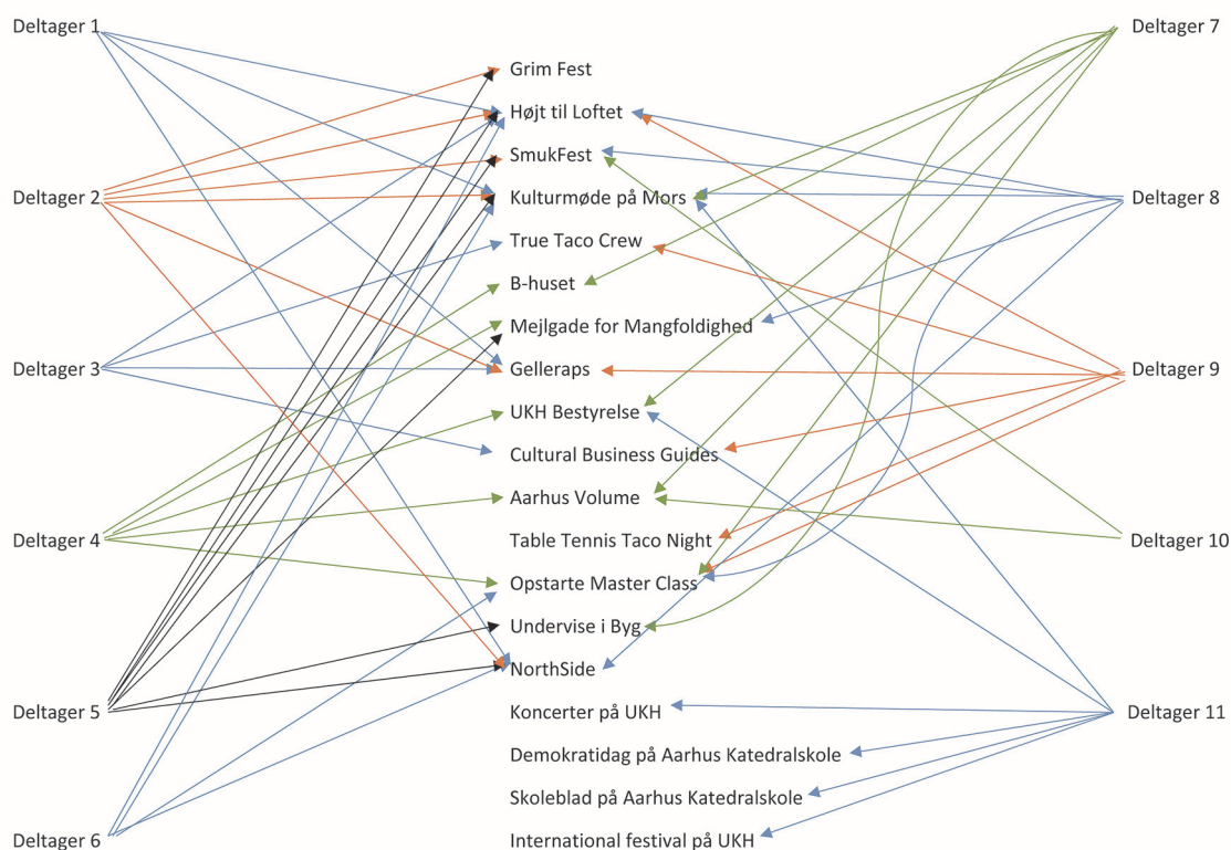
Figur 1: Masterclassdeltagernes "fælles frivillig-CV" for det seneste år

Trods de mange lighedspunkter rummer gruppen også forskelle.