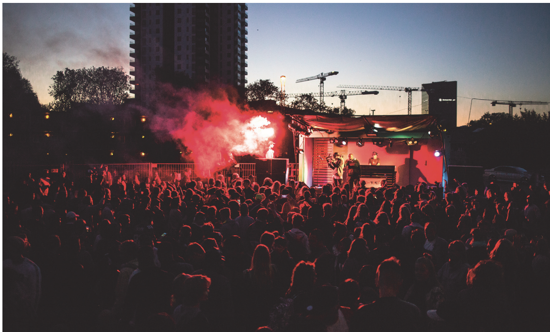
Stemmingsbillede fra gadefesten Aarhus Volume den 11. juni 2016.

'Gadefesten' er det første arrangement i foreningens regi, men på længere sigt er det meningen, at foreningen skal afholde flere kulturelle aktiviteter. Et af projekterne var på interviewtidspunktet at søge at skabe et helt nyt spillested på Godsbanen.