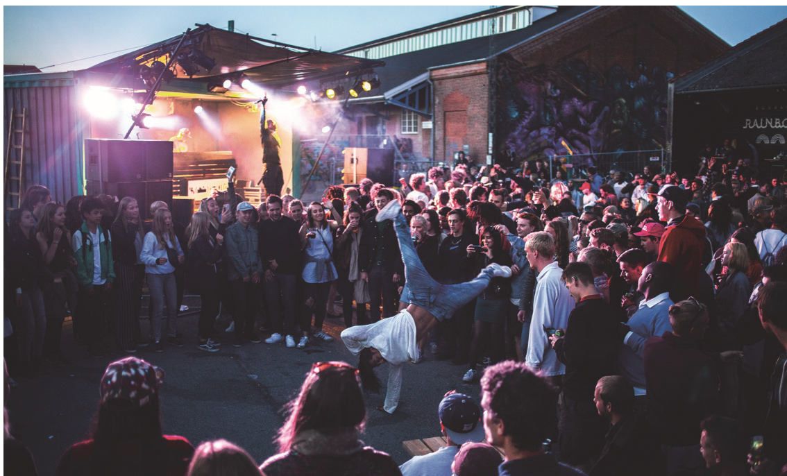
Stemmingsbillede fra gadefesten Aarhus Volume den 11. juni 2016.

Alt i alt resulterede det i en Gadefest, som spredte sig ud over hele Godsbanen. Musikstilen varierede mellem de forskellige scener, og hele arrangementet tiltrak folk i alle aldre i løbet af dagen og blev senere 'overtaget' af det yngre segment. Udover Aarhus Volumes egen efterfest var der efterfest i Double Rainbow og Radar. Samme armbånd gav adgang til alle tre fester.