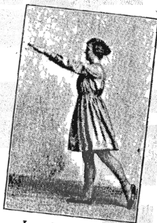
„Landsdragten“, Mønsterbeskyttet Facon.