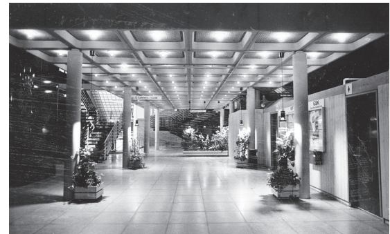
Forhallen i Greve Svømmehal var i 1978 udformet efter tidens smag. Møde- og udstillingslokaler var med til at gøre svømmehallen til andet og mere end et sted for sportsudfoldelse.

I dag står svømmehallen som et højdepunkt for – og monument over – den kommunale idræts- og velfærds politik i Greve. I den nye storkommune var idrætten blevet symbolet på velstand og velfærd, midlet til at opnå fælles identitet for