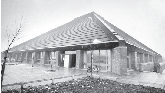
Greve Svømmehal med sin pyramideform blev i 1978 praktisk placeret ved siden af Greve midtby center og Greve station. Kommunen havde også tænkt på energiforbruget, hvorfor taget var forsynet med solceller, der skulle producere strøm til svømmehallen.