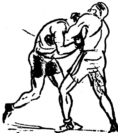
SITUATION FRA AKEL-VAN HAECKE KAMPEN