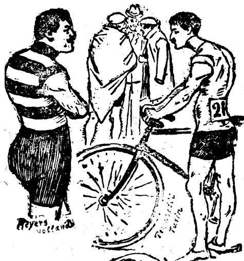
Geo Banker Amerika