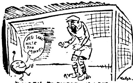
BOLDEN SPANDSERER IND I DET SPANISKE MÅL, MEN MÅLMANDEN SVÅLDER UD