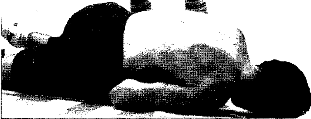
Bilag 1. Berlingske Tidende den 16. marts 1992.