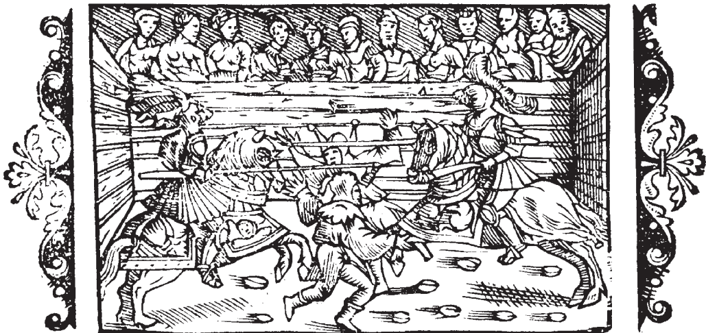
Turnering, disciplinen 'renden'. To narre laver grin med oprinet (Olaus Magnus: Historia om de Nordiska Folken, 15. Bog, kap. 18).

Lanserne var normalt lange stager med stumpe ender, lavet af fyrretræ med en styrke, så de kunne støde en rytter af hesten, men knækkede hvis ridderen sad fast i sadlen. Det var ærefuldt, hvis ridderen var i stand til at blive siddende i sadlen, når han blev ramt, så lansens knækkede. Undertiden var stagerne bevidst gjort skøre, så de fornemme fyrster kunne vise deres mod og styrke. At lanserne ofte brækkede, afspejler sig i udtrykket 'stikke og brække' om denne turneringsform. I regnskabet for hertug Frederik af Slesvig-Holsten for året 1490 nævnes der udgifter på 2 sk. til 'rendestager', mens han opholder sig på Asnæs. 37