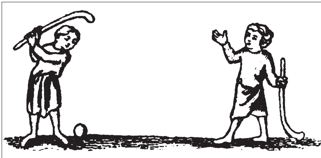
Boldspil med stokke, svarende til hockey eller 'so I hul', England 14. årh. (Jørn Møller: Gamle idrætslege i Danmark, bind 1, s. 75 (efter J.Strutt)).

tinske tekst bruges ordet 'bacilli' (buede stave) i flertal. Den ordrette oversættelse lyder derfor: »Legen er klar for den, som man giver bold og stave.« Derfor er jeg mere tilbøjelig til at mene, der henvises til en form for hockey eller lacrosse (so i hul), der begge kendes fra Frankrig i senmiddelalderen. 28