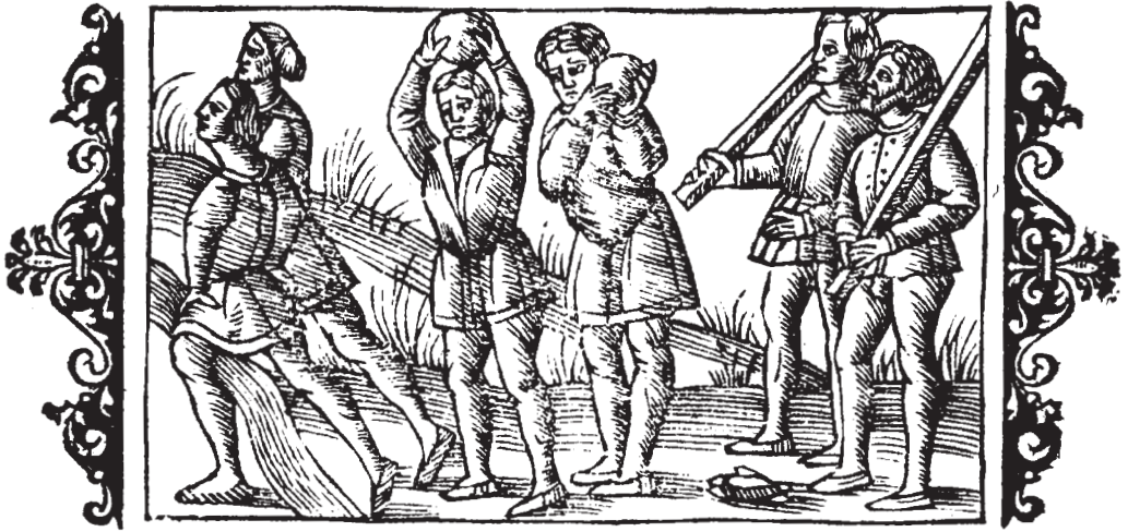
Spring over vandløb, stenløft og stokke, måske til stangspring (Olaus Magnus: Historia om de Nordiska Folken, (Rom 1555), Sth. 1976, 5. Bog. kap. 26).

Styrkeprøverne kunne også gå ud på at løfte tunge sten, som Olaus Magnus beskriver og gengiver det på et træsnit i sin beskrivelse af Norden. Det er iøvrigt en af de opgaver, der indgår som disciplin i stærkmænds-idræt (aktuelle konkurrencer om at blive verdens stærkeste mand). Opgaven kunne gå ud på at holde sig længst muligt hængende i én arm. Styrkeprøverne kunne også foregå mellem to modstandere, der holdt deres krummede arme om hinanden og trak til, indtil en af parterne blev trukket frem eller tvunget til at rette armen. Eller det kunne være hænderne, der blev holdt krummede. I dag bruges armlægning på tilsvarende måde.