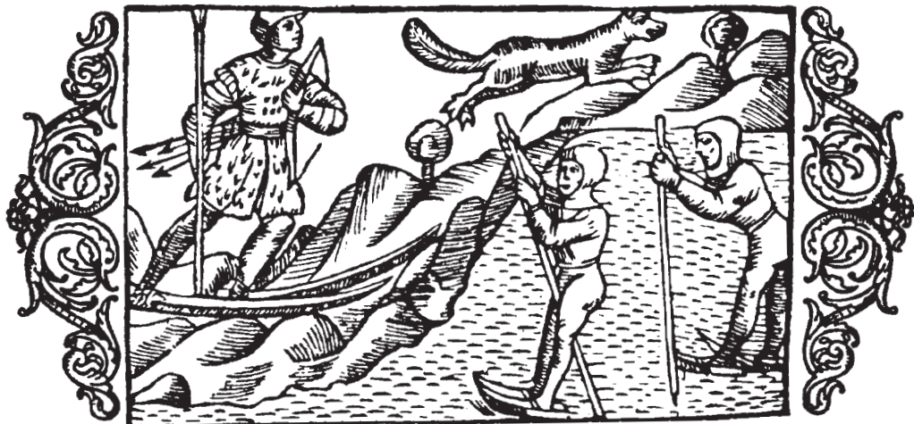
Skiløb og skilskøjteløb på isen (Olaus Magnus: Historia om de Nordiska Folken , 20. Bog, kap. 17).

af en stang på fod med en spids fane, hvorpå to pile krydser hinanden.