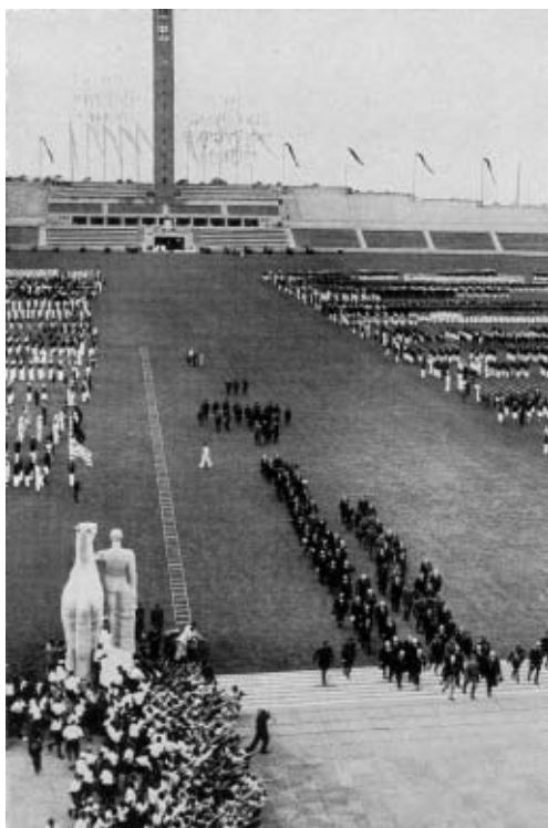
IOC ankommer til »Maifeld« med Adolf Hitler I spidsen.

De Olympiske Lege i 1936 blev allerede i 1931 givet til Berlin. De skulle finde sted i det om- og udbyggede Grunewaldsstadion, der var blevet opført i den vestlige del af byen i terrænet omkring Grunewald i forbindelse med De Olympiske Lege i 1916. 58 Werner Mach, søn af Grunewaldsstadions arkitekt, fik det hverv at planlægge ombygningen. Efter nazisternes magtovertagelse syntes De Olympiske Leges fremtid i Tyskland i første omgang at være usikker, fordi De Olympiske Leges rekordorientering og internationalisme ikke syntes at passe ind i de nye magthaveres politiske koncept. 59 For at gennemføre legene talte imidlertid