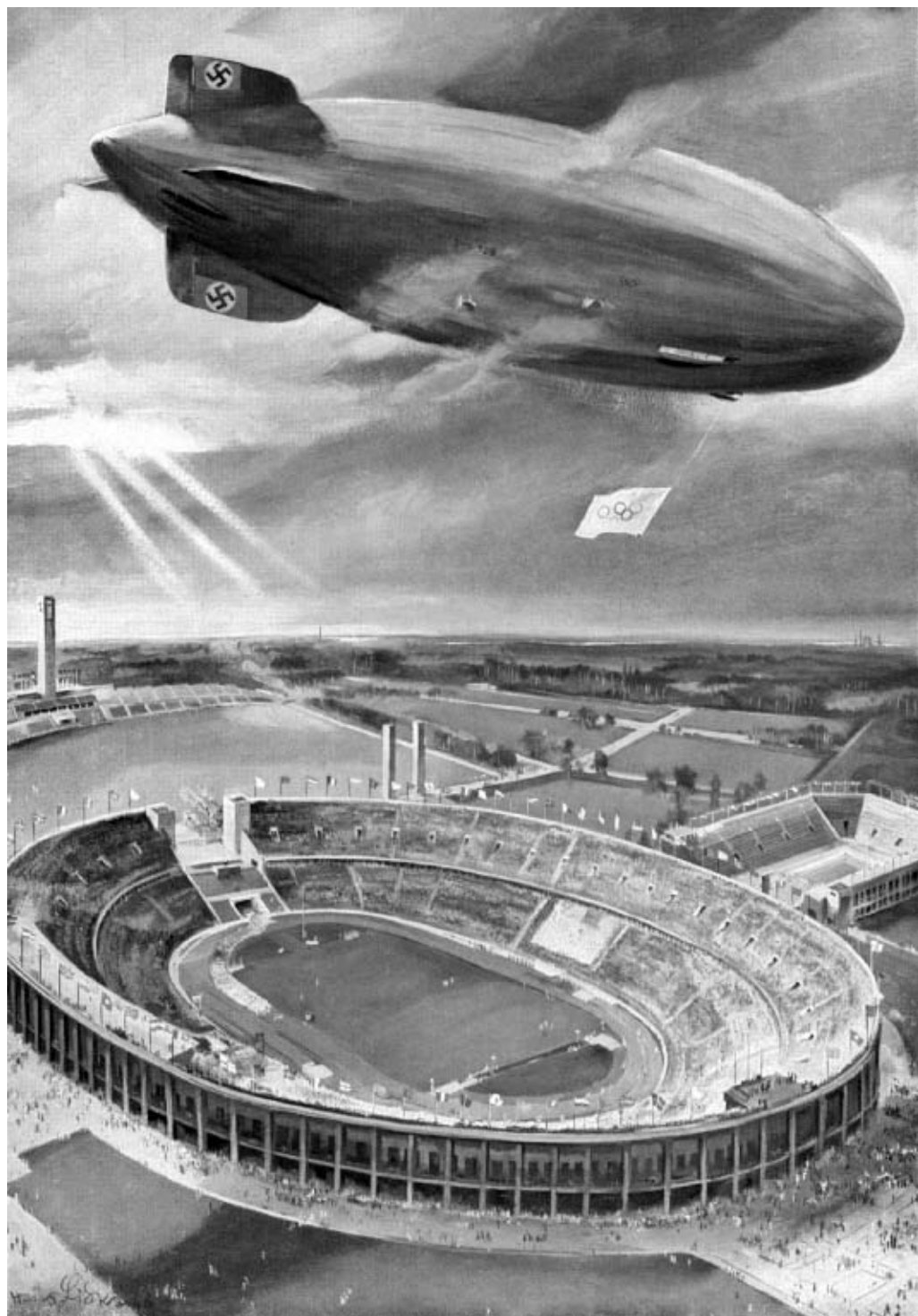
Luftskibet »Hindenburg« over »Reichsportfeld«. Hans Liska, 1936.