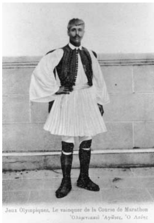
Spiridon Louis, vinder af Maraton i 1896.

nemføre De Olympiske Lege i Athen vigtige fortalere, men også stærke modstandere. Olympia-ambitionen blev understøttet af den fra Danmark stammende kongelige familie, frem for alt af Georg I og kronprins Konstantin. De anså sporten for et tegn på modernitet, men håbede også på en legitimitet gennem bekendelsen til det antikke. Legene tilbød sig som en fremragende arena for offentlig præsentation, hvorved på en gang internationalitet og forbundetheden med det græske folk – gennem tilegnelsen af den antikke arv – kunne demonstreres. Konstantin havde allerede i 1890 talt for gennemførelsen af nationale Olympiske Lege, og han blev senere præsident for organisationskomiteen. 32