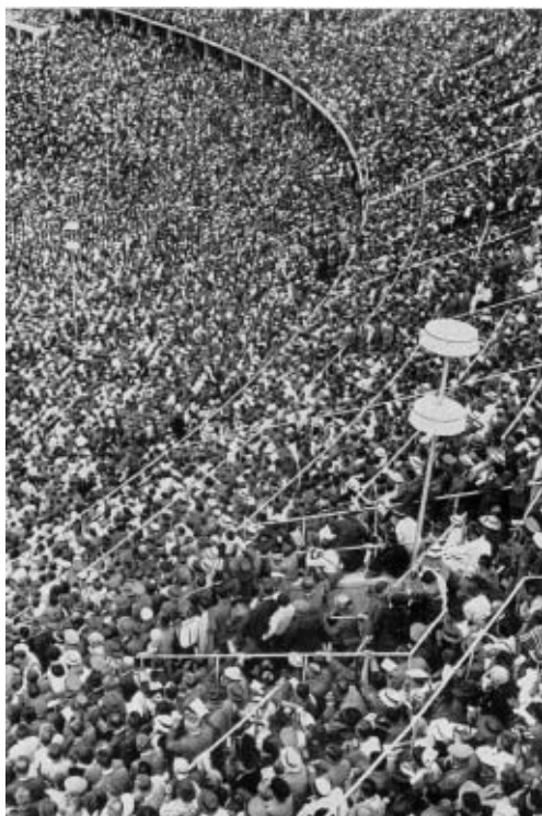
Hundredetusinde tilskuere var daglig på stadion.

Andre mosaikker af iscenesættelse af kollektive erindringer er Dietrich-Eckart-scenen, en friluftsscene i stil med et græsk teater, Majpladsen, en indmarchsplads til massebekendtgørelser for op til 250.000 mennesker, udkigstårnene, der er opkaldt efter de tyske stammer, og som prægede panoramaet og skulle give indtryk af en fæstning, ligesom den 200 år gamle »Podbielski-eg«, der både tjente som symbol på den tyske styrke og som pendant til det hellige oliventræ ved indgangen til Zeus-templet i Olympia. Søjlerne, som de tyske olympiske vindere blev forevigt på, blev opført på Hitlers initiativ og giver mindelser om den yngste fortid. Særligt heftigt di-