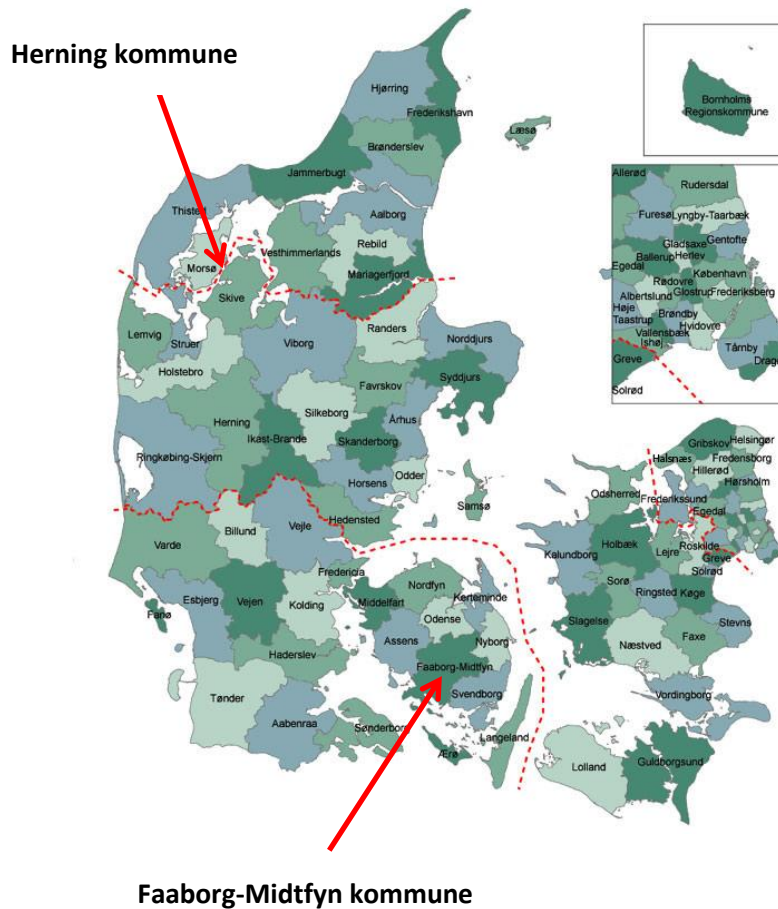
Figur 3: Kort over case-kommunernes placering