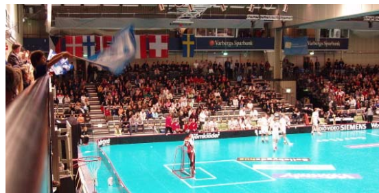
Mændenes semifinaler i European Cup 07 mellem finske Espoon Oilers og svenske Warberg IC

Måske netop på grund af mindre idrætsgrenes vanskeligheder med at trænge igennem i det etablerede mediebillede i tv og aviser har en ny idrætsgren som floorball fået godt fat på nettet. Meget kommunikation foregår via nettet, og mange danske floorballklubbers hjemmesider er underholdende og omfangsrige.