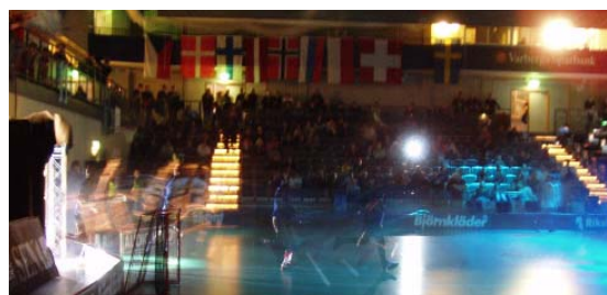
En pompøs entre med gode (net)-tv-billeder ved European Cup i Varberg

Også i andre idrætsgrene findes specialiserede internetmedier med levende billeder som Xfloor.tv. De er bare udenlandske. Denne artikel undersøger, hvad der rent faktisk skal til for at skabe en sådan net-tv-kanal i Danmark. Udgangspunktet er som nævnt floorball, men perspektiverne gælder også andre idrætsgrene. Vi har nedenfor opdelt i produktion og distribution, og de tekniske løsninger går lige fra de meget ambitiøse (og dyre) og til de små, mere simple løsninger.