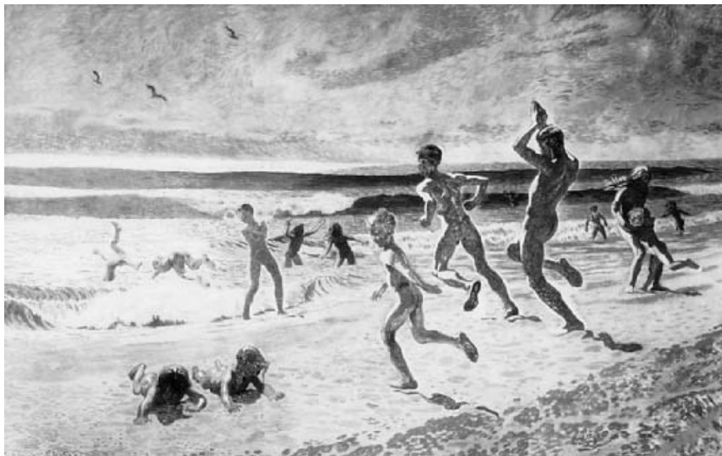
Badende børn på Skagens Strand. Generalprøve. 1909. Olie på lærred. 265 x 425 cm (deponeret af Skagens Museum).

leger i samtiden er det da menneskekroppen placeret i et rum, der optager ham, hvor menneskekroppens finale karakter og evne til at skabe unikke øjeblikke kontrasteres af havets rytmiske brænding med dens evigt gentagne bevægelse. Sol og ungdom har nok karakter af et naturbillede, men som altid hos Willumsen er denne natur befolket. Det er med andre ord menneskekroppens evne til at sætte præg på naturen og dens evne til – via kontrast – at lade naturen komme til sin ret, der er i søgelyset. Således er der i sidste instans tale om en raffineret leg med og afsøgning af det inderligt kulturelle spørgsmål om betydningens skabelse i relationen mellem forskel og lighed. Willumsen er ikke harperomantiker, han er kunst-maler. Hos ham mere end nogen anden ser vi spændingen mellem kroppen som anledning og glæden ved kroppens egenfærdighed. Her er spændin-