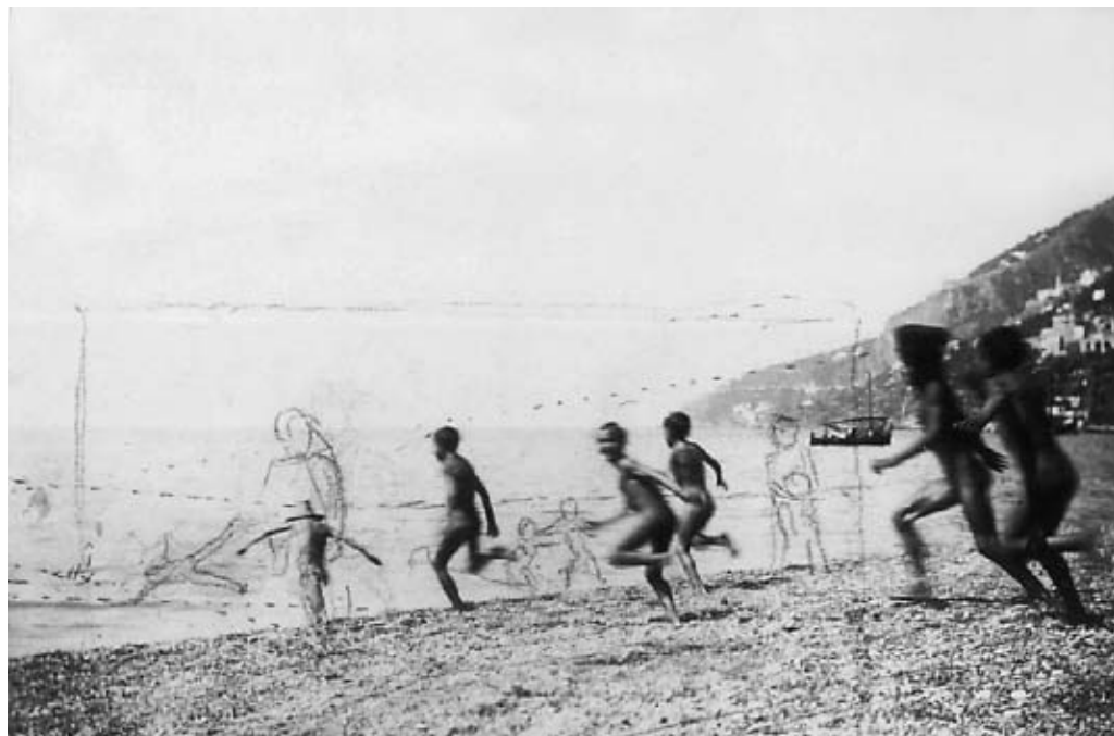
Seks løbende drenge på stranden ved Amalfi, 1902 eller 1904. Fotografi med blyantstegning.

det tydeligt at se, hvorledes der sker en forskydning bort fra det maritime i retning af kombinationen menneske og hav. I 1904-udgaven ser man ganske vist en 4-5 badende skikkelser ude i havet, men det er dog mest af alt et marinemaleri. Hvor anderledes er da ikke de to, næsten identiske 1909- og 1910-udgaver. Her er vi meget tættere på både hav og mennesker.