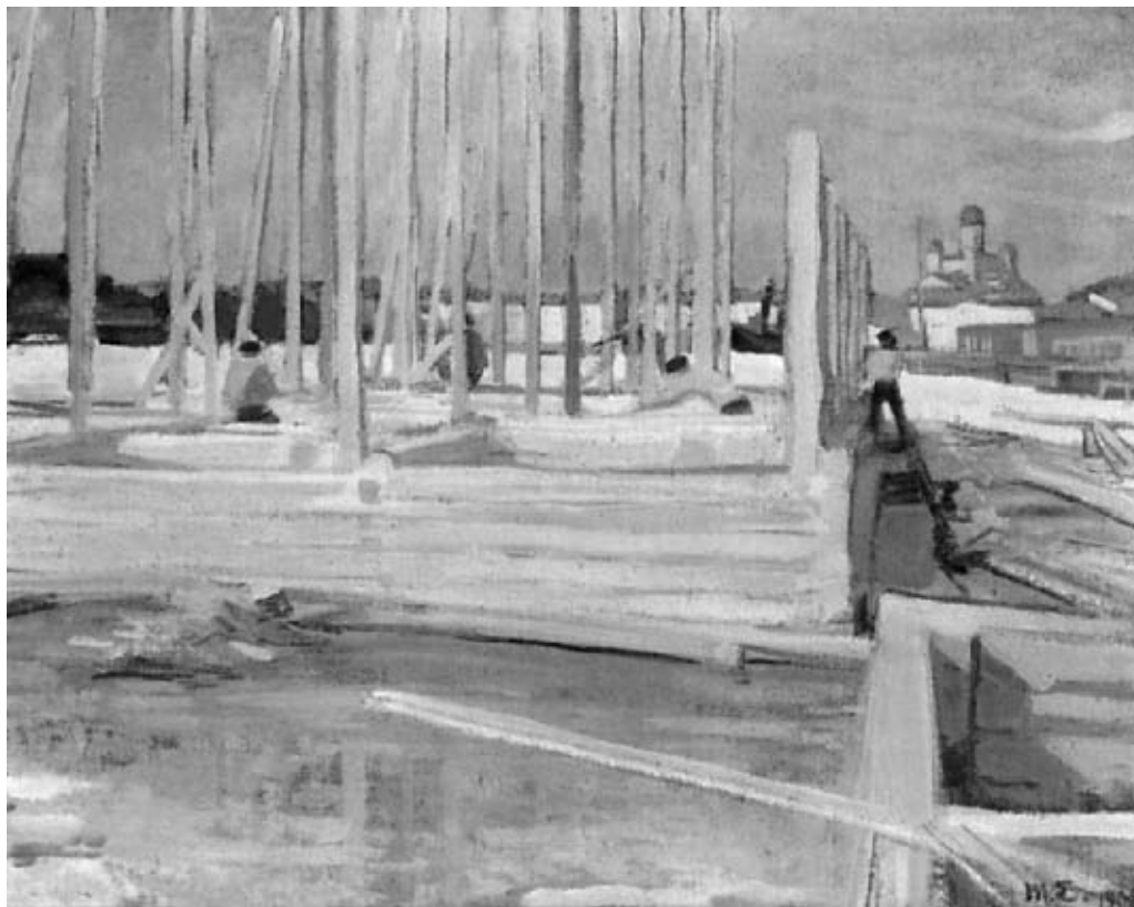
Magnus Enckell, Silta-arkkuja Katajanokalla/Brokistor, Skatudden 1908.

på skrømt. »Jag gör det för mitt eget nöjes skull, för att skärpa mitt öga«, skriver han hjem.