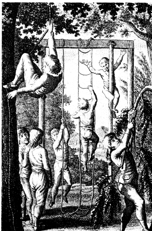
Illustration fra J. C. F. Guts Muths. »Gymnastik für die Jugend« Schnepfenthal 1793. Nr. 6.