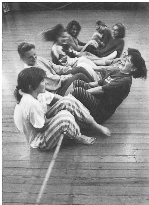
Der trækkes »stavkrog« på Idræthistorisk Værksted.

Om en revitalisering af de gamle lege kan indfri disse store forventninger er tvivlsomt. De gamle lege levede og fik deres mening i et relativt statisk samfund med en sammenhæng i traditioner og hverdagsritualer, som er dybt forskellig fra vores måde at leve på. De gamle lege vil i første omgang spontant blive forbrugt ud fra den nyhedsværdi, de repræsenterer, mens det vil stille store krav til involverede og interesseredes energi og vedholdenhed, at skaffe rum og rammer for legen, at opbygge spilforståelse og vælge repertoire med passende situationsfornemmelse, at oparbejde betydningsrum, som bringer kvaliteten i lege til fuld udfol-