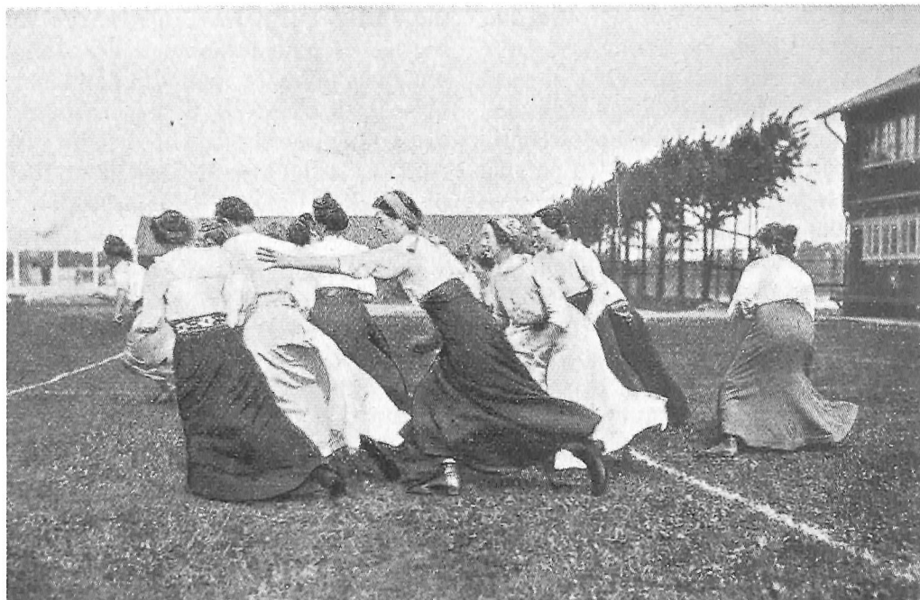
Lærerinde lærer at lege »nat og dag«. Illustration fra udvalgets årsberetning.

ældre og sogneråd kunne have svært ved at forstå. Det fremgår indirekte af udvalgets første årsberetning, hvor komikken lurer i følgende patetiske erklæring om legesagen: »Vor Sag har ingen større Fare at frygte end den, at den skulle glide ud i Løshed og Pjank«.