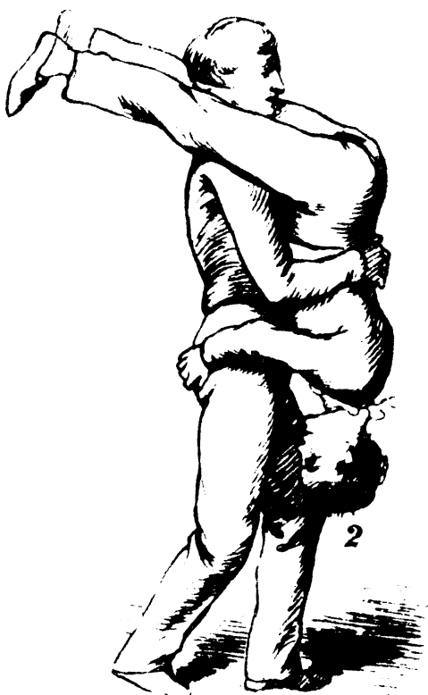
»Vende steg« Illustration fra J. Lauritsens »Underholdende og dannende Legemsøvelser for unge Mennesker«. (1865).

Det hedder i indledningen til 1. del: »Det er først naar Folk af egen Drift udfylde en Deel af deres Fritid, især den, som unge Mennesker tilbringe i hinandens Selskab med dannende og underholdende Legemsøvelser, at man kan sige at Friheden og Oplysningen have beaandet Folket i den Retning (kraft, hårdførhed, mod). For endmere at udvikle denne Sands hos den opvoxende Slægt, vort fremtidige eneste Dannevirke, og for at forøge det Stof, som paa en hensigtsmæssig Maade saavel kan tilfredsstille Trangen hos den Unge til at røre sig som Samfundets Krav paa at faa kraftige til Livets