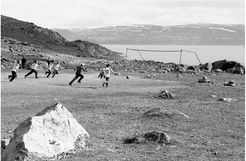
Grønlandske børn der spiller fodbold – 2006.

er ikke bare et spørgsmål om at underskrive en hjemmestyreaftale og hejse det grønlandske flag. Det handler også om at tænke og handle anderledes end tidligere – udfordre den tidligere tankegang. Det gælder for både grønlandere og danskere.