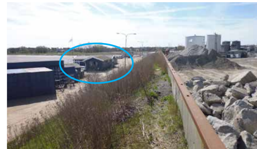
Klubhuset i Køge Kano og Kajak Klub er beliggende på Søndre Mole ved Syddstranden i Køge, hvor en gennemgribende udvikling af havneområdet finder sted.