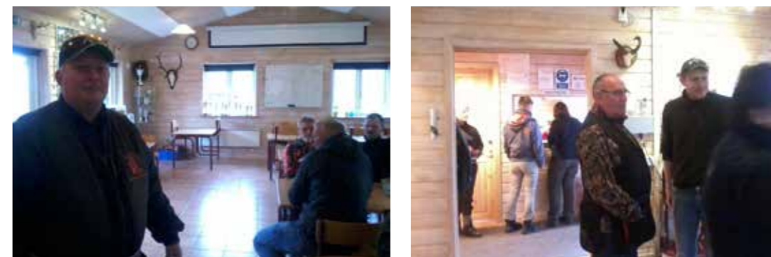
Det store opholdsrum med caféen og langborde (tv.) samt kig til entréen og klubhusets kontor, hvor medlemmerne står i kø for at indskrive sig til en tur på skydebanen i Hedehusene-Fløng Jagtforenings klubhus ved Skydebane Vest (th)

Caféen er udelukkende drevet af frivillige, og har åbent hver tirsdag og onsdag aften i det tidsrum, hvor der skydes. Derudover indeholder klubhuset et kontor med åbning ud til entréen. Det er her medlemmerne står i kø for at indskrive sig til en tur på skydebanen. Og endelig rummer klubhuset et større redskabsrum med et aflåst skab til geværer mv.