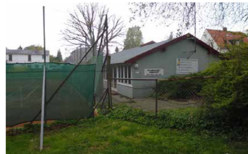
Klubhuset Annekset er beliggende ca. 300 meter fra Kildeskovshallen

Klubhuset Annekset er beliggende på Kildeskovsvej 34 C i nærheden af Kildeskovshallen i Gentofte Kommune. Annekset er et klubhus, som følgende seks idrætsforeninger deles om adgangen til: Gentofte Svømmeklub, Gentofte Volley, Gentofte/Vangede Håndboldklub, SISU Basketball Club, Skovshoved Triathlon Klub samt Gentofte Cykel Club. Fire af disse har træningsaktiviteter indendørs i Kildeskovshallen, mens idrætsaktiviteterne i to af foreningerne (Skovshoved Triathlonklub og Gentofte Cykelklub) fortrinsvis foregår uden for i naturen.