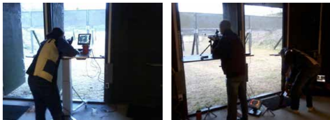
Lokale, hvorfra medlemmerne skyder med riffel med det nyerehvervede elektroniske computerudstyr.

Reerslev Skytteforening og Fløng-Hedehusene Skytteforening, som er beliggende i den anden ende af Skydebane Vest, deles om et klubhus. Dette klubhus består af en større opholdstue, et aflangt lokale, hvorfra riffelskydningen foregår samt et lokale for pistolskydning. Disse rum ligger i hver sin ende af en lang gang med opholdsrummet i midten. Udover skydefacilitetsrummene er her toiletter samt baderum.