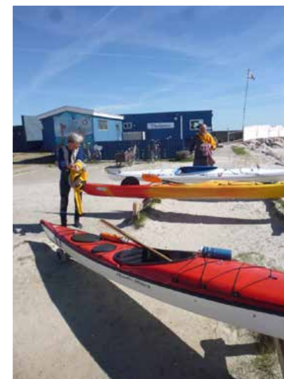
Det sociale samvær udspiller sig på terrassen foran klubhuset alt imens 60+ medlemmerne vender tilbage fra deres roture i farvandet syd for Køge.