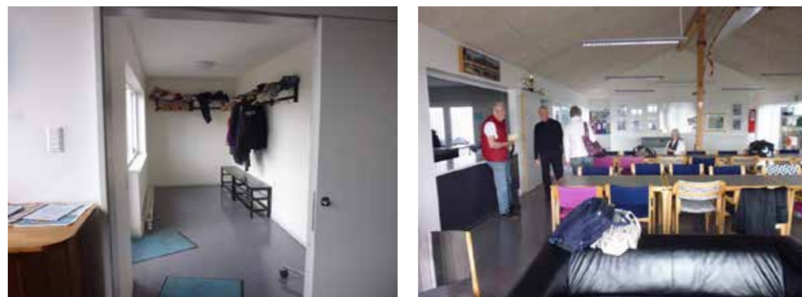
Klubhusets store lyse entré (tv.) samt opholdsstue med spiseborde og sofagrupper (th.)

eller reparation af både samt andet inventar og udstyr. I de to store bådopbevaringsrum er der desuden placeret ro- og kajakergometre, hvor medlemmerne træner, når de ikke er på vandet. Og endelig er der et specifikt træningslokale med forskellige styrketræningsredskaber samt et musikanlæg.