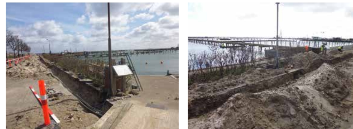
Igangværende renovering af Skovshoved Havn, april 2015

Skovshoved Roklub er en stor forening med ca. 500 medlemmer beliggende ved Skovshoved Havn, som har eksisteret siden 1938. I løbet af vinteren 2014-2015, hvor klubhusundersøgelsen er blevet gennemført, er der foretaget en gennemgribende udvidelse og renovering af Skovshoved Havn 3 . Dette har betydet, at det ikke har været muligt for medlemmerne at komme på vandet fra Skovshoved Havn i den forløbne vintersæson.