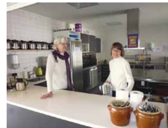
60+ medlemmer i Køkkenet i Skovshoved Roklub

Da jeg besøger Skovshoved Roklub i midten af april måned hersker der en særdeles munter og hyggelig atmosfære blandt 60+ medlemmerne i foreningens klubhus. Mens Preben, som er materiel-ansvarlig i ro-afdelingen viser mig rundt i roklubbens klubhuslokaler og faciliteter, er der liv i baderummene både på dame- og herresiden. Snakken går livligt blandt 60+erne i omklædningsrummene, mens medlemmerne bader og klæder om efter endt ergometertræning, og i opholdsstuen er de ældre i gang med at brygge kaffe og dække op ved bordene. Et yngre mandligt medlem er i fuld gang med et målrettet træningsprogram i træningsrummet. Der er ingen tvivl om, at medlemmerne har stor glæde af såvel det træningsrelaterede som det sociale fællesskab og samvær, der er mellem 60+erne i foreningen. De er en gruppe, der kender hinanden på kryds og tværs, hvilket man mærker med det samme på måden, de kommunikerer og laver sjov med hinanden. Da jeg er blevet vist rundt i alle lokalerne, bliver jeg tilbudt en kop kaffe, og jeg falder i snak med nogle af damerne. Her går snakken