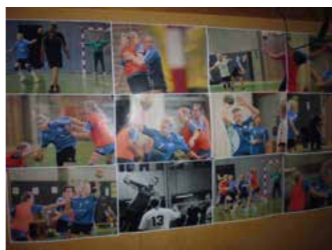
Et glaskab med pokaler på endevæggen i opholdsstuen (tv) og fotokopier med billeder fra kampe i Gentofte-Vangede Håndboldklub er den eneste udsmykning i det store opholdsrum i Annekset (th).