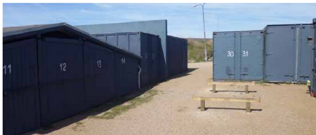
De oprindelige blå bådopbevaringshuse (til venstre i billedet) er blevet suppleret af blå containere, som klubben har fået af kommunen til opbevaring af såvel klubbens som medlemmernes private kanoer og kajaker i 2011. Bag ved containerne ligger Bjæverskov Kajakklubs 'nye' klubhus, som blev anlagt på Søndre Mole i sommeren 2014. Dette klubhus stod tidligere på en lille campingplads i området, men er nu flyttet herved og tildelt Bjæverskov Kajak forening.

Køge Kano & Kajak Klub er medlem af Dansk Kano og Kajakforbund og deltager aktivt i DM og NM arrangementer. Foreningen er desuden medlem af DGI og kan ad den vej tilbyde billige kurser og events af særlig interesse for havkajakroerne. Mange af klubbens medlemmer deltager i løb, og en del løb støttes ved, at klubben betaler startgebyret. Selv arrangerer klubben Tryggevælde løbet som start på sæsonen. Foreningen tilbyder desuden aktiviteter i forbindelse med den årlige 'Søndre Havnedag', som afholdes hvert år i august. Foreningen tilbyder aktiviteter i forbindelse med 'Sommersjov for børn', et tilbud til alle skolebørn i Køge kommune.