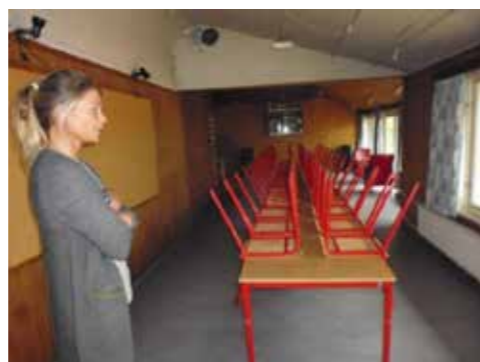
Det store rektangulære opholdsrum i Annekset er indrettet med et langt bord og opstablede stole (tv) samt to røde lænestole, som er placeret overfor ved vinduet ud mod terrassen og tennisbanerne (th).