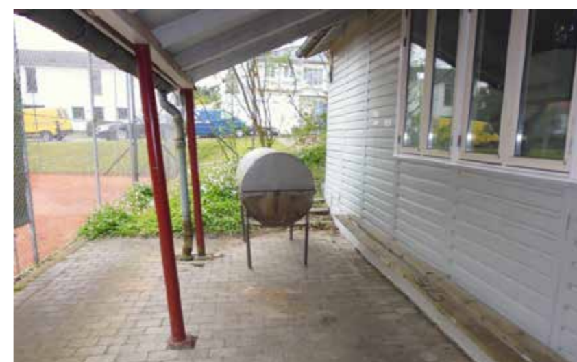
Terrassen foran Annekset ud mod tennisbanerne

I spørgeskemaundersøgelsen deltager tre af de seks foreninger, der har adgang til Annekset, nemlig Gentofte Svømmeklub, Gentofte Volley samt Skovshoved Triathlon Klub 5 .