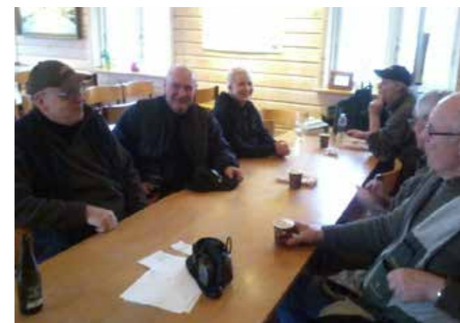
Kaffe og øl og livlig snak ved bordene i Hedehusene-Fløng Jagtforening.

Da jeg besøger foreningerne ved Skydebane Vest er der en livlig aktivitet i området. Ude på området omkring skydebanerne og på terrassen foran den store træhytte er der masser af mennesker samlet. Det er vanskeligt at se, hvem der hører til hvor og der skydes på kryds og tværs på arealet. Indenfor i klubhuset i Hedehusene-Fløng Jagtforening hersker der ligeledes en særdeles livlig aktivitet og stemningen er høj. Der er et sandt mylder af folk ud og ind af huset. Flere mænd står i kø ved lugen til kontoret for at indskrive sig til en runde på skydebanen. Jeg sætter mig ved et af langbordene og falder i snak med et par af de yngre medlemmer i lokalet - en kvinde på 29 og en ung fyr på 16 år. Rundt omkring os i lokalet står en mænd og snakker. De drikker kaffe og øl, men mest øl. En kvinde på 29 fortæller, at hun er her fordi hendes kæreste er medlem af foreningen og kommer her rigtig meget. (Observationsbesøg, april 2015).