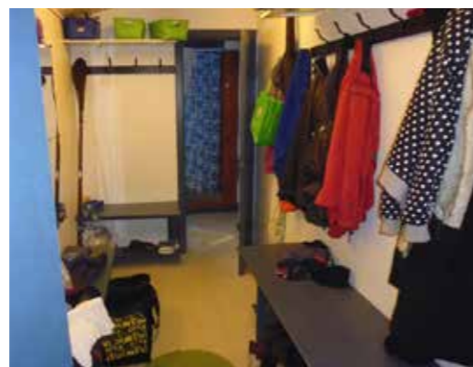
Klubhusets primære rum er et køkkenalrum med spiseborde og kajakergometre og andre træningsredskaber, der står ind mellem bordene, og som bruges til vintertræning (tv). På billedet til højre ses det ene omklædnings- og opbevaringsrum samt bruserumsfaciliteterne i baggrunden.