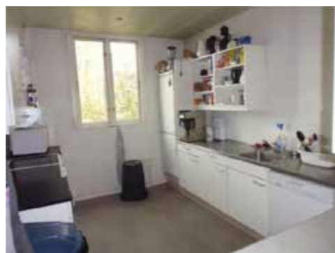
Det mindre opholdsrum er ligeledes meget neutralt indrettet med bænke og borde og et spil bordfodbold og fjernsyn (tv). Køkkenet i klubhuset fremstår stort og rummeligt (th).

Derudover vidner indretningen ikke om det liv og de mennesker, der færdes i klubhuset. Rummene i klubhuset fremstår derimod meget neutrale og 'sterile', hvilket først og fremmest må ses som et udtryk for, at den enkelte forening 'rydder op efter sig', så huset er klar til næste forenings-arrangement.