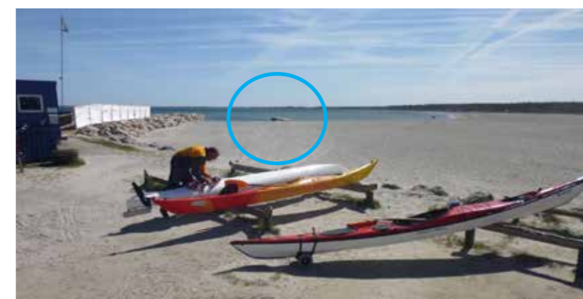
Udsigt fra klubhusets terrasse med den nyetablerede isætningsbro og det 100 meter brede nye strandområde. Kano og kajakroerne har fået længere vej til vandet som følge af det nyudviklede strandområde.