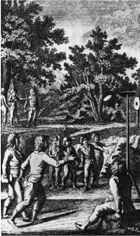
Kobberstik fra GutsMuths: »Gymnastik für die Jugend«, 1793. Øverste gruppe: Bueskydning mod skive. Midterste gruppe: Spydkast og stenkast. Nederste gruppe: Diskoskast efter horisontal skive.

Udvælgelsen skyldes formentlig, at kancelliet i 1811, inden den kgl. resolution blev udstedt, havde haft gymnastikplanerne til høring i de 10 amtsskoleledelser (alle placeret øst for Lillebælt) som var blevet oprettet. Bortset fra Præstø amt, der afviser gymnastikken, er de øvrige amter positive. Synspunkterne deler sig i et filantropisk og et militært synspunkt, og resolutionen synes at være et kompromis, uden at der dog heri ligger en egentlig forklaring på, hvorfor det netop er de nævnte øvelser,