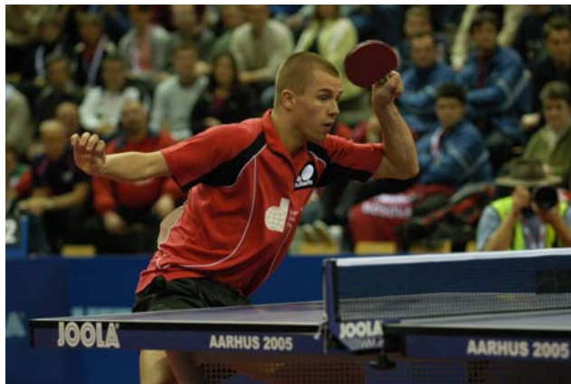
Fototekst: EM bordtennis 2005 i Århus