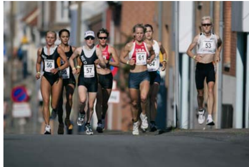
Fototekst: VM lang triathlon 2005 i Fredericia

Af tabel 4 fremgår det, hvor mange idrætsgrene, der var i spil i de enkelte værts amter tillige med det samlede antal begivenhedsdage pr. amt. "Antal begivenhedsdage" bruges til senere at beregne, hvor stor en turismeomsætning en enkelt begivenhedsdag i gennemsnit har genereret.