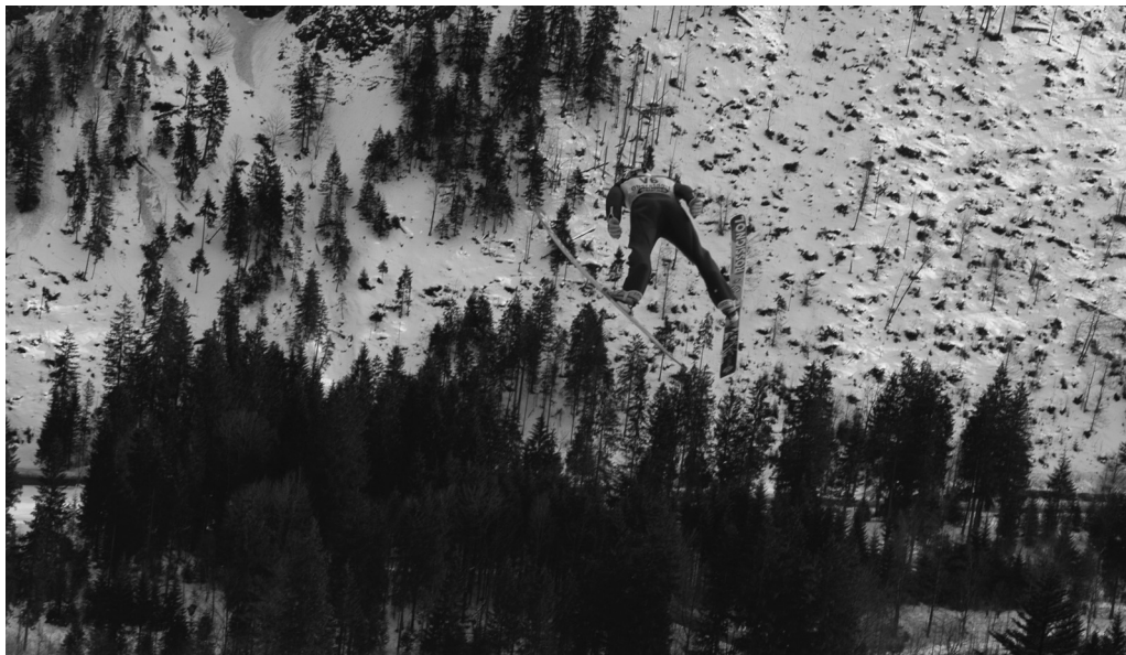
Højt over træerne svæver skihopper, når der er konkurrence på skihopbakken i Oberstdorf.

rilitet. Hvis man betragter mediedækningen af sportsgrenen og skihoppernes images før og efter V-stilens opkomst, kan man stille spørgsmål ved, hvorvidt rammerne i den medierede sportsverden for adfærd og udfoldelse af maskulinitet er blevet bredere, smallere eller mere normative?