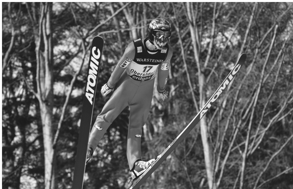
Skihopperne er i bogstaveligste forstand flyvende på skihopbakken i Oberstdorf.

side desuden alt for at forbedre deres fremtræden, fremhæve deres (gode) udseende og spille deres roller som mandlige skønheder. De farver håret rødt eller får striber i, bærer iøjnefaldende smykker og går i dyrt mærketøj. 37 Ifølge Bild er Hannawald forfængelig – altid med gele i håret og duftende af Christian Diors parfume »Higher«. 38 I et interview fortæller Hannawald at »Jeg bruger renselmælk. [...] Jeg kan lide at gå i lækkert tøj, og jeg synes, at folk i parfumereklamer er cool påklædte.« 39 Det viser, at de to skihoppere ikke følger (sportens) traditionelle maskulinitetsnormer, men skaber nye images og praktikker såsom deres åbenlyse fokus på udseende og hudpleje; images som defineres som feminine inden for de eksisterende kønsregimer. Men det kan de ikke gøre ustraffet, idet medierne beskriver heltens »feminine vaner« med en blanding af beundring, forbavelse og forargelse. Det