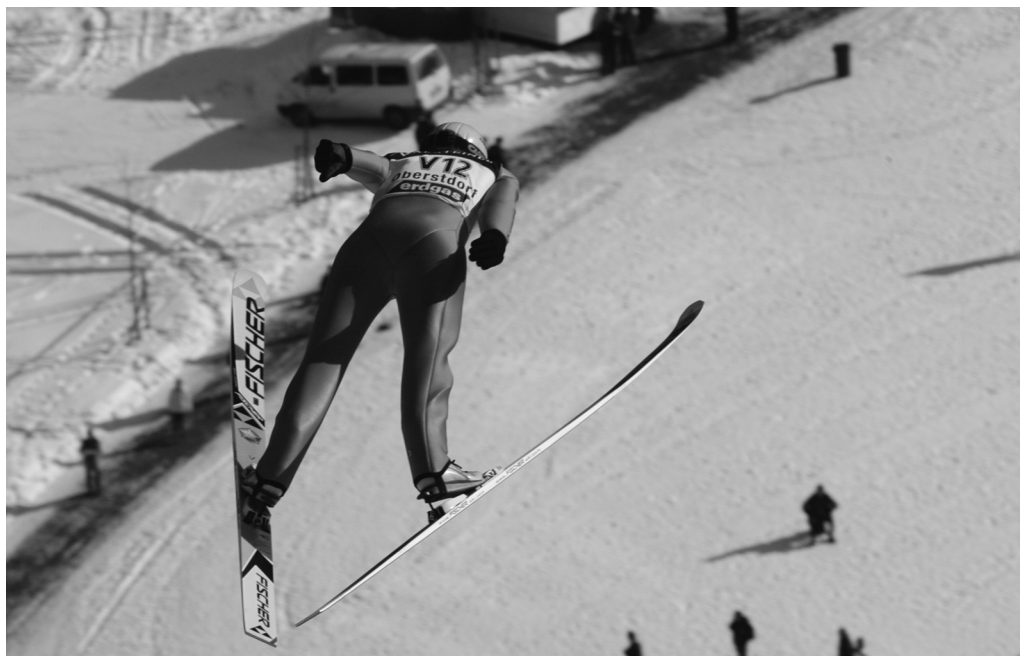
De tyske skihoppere sprang i 1990'erne ud som superstjerner. Skihopper på skihopbakken ved Oberstorf.