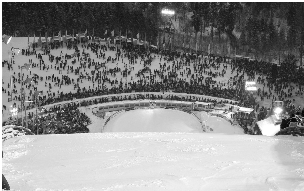
Et kik ud over skihopbakken i Oberstdorf.

»luftens konge«, »himlens mester« eller endog »den hoppende gud« indikerer, at udøverne opleves som helte. 27 Den hyppige brug af »vores« indikerer national stolthed og giver læserne mulighed for at identificere sig med deres »tyske idoler«. 28