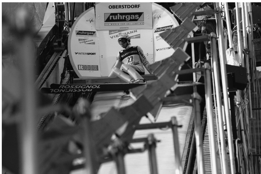
Skihoppkonkurrence i Oberstdorf.

Skihopp begyndte imidlertid at dale i popularitet efter 2. Verdenskrig, ikke mindst fordi det var umuligt at forbedre præstationerne på de eksisterende, relativt små ramper.