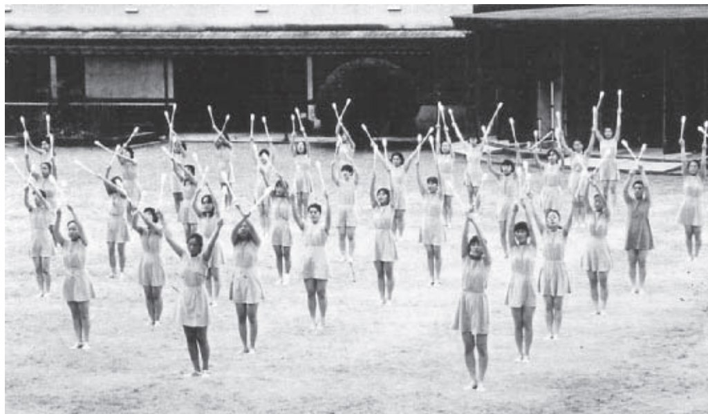
I dag dyrkes Bukhs gymnastik fortsat i Japan omend i forskellige blandingsformer, her med køller. Billedet er fra en forskningsrejse i 1992 og viser en opvisning af elever på den nationale sportsdag i oktober 1992 i lyseblå Ollerupdragt på Jiyu Gakuen-skolen.

Tilsyneladende nåede Niels Bukhs gymnastik også en vis udbredelse i Korea, som følge af at det japanske militær bragte den dertil. Paradoksalt nok er der tegn på, at den koreanske modstandsbevægelse udnyttede, at Niels Bukhs gymnastik var et helt legalt påskud til at samle unge koreanske mænd, som deltog i befrielseskampen. 110 Der kan fortsat i dag findes klare spor af Bukhs gymnastik i Korea. 111