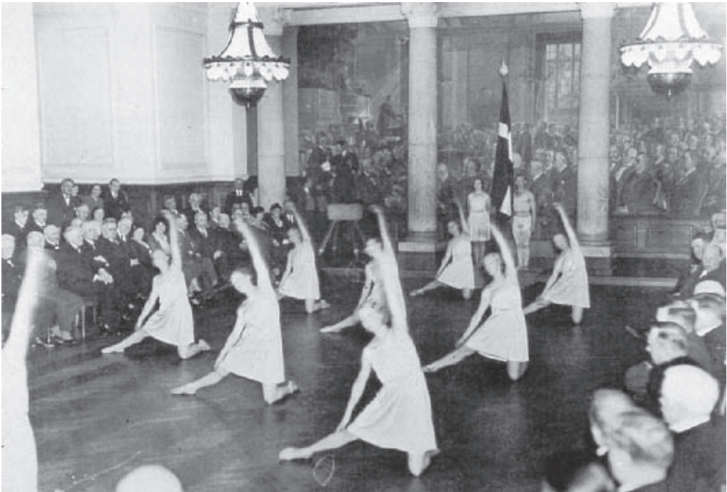
Opvisningen på Christiansborg. Bemærk bukken foran freskomaleriet af overrækkelsen af Grundloven og den ranke mandlige og kvindelige gymnast, der står fanevagt. De siddende, ældre mandlige politikere i mørk habit danner en stærk kontrast til de unge yndefulde kvinder i lyse dragter.

For den højre-radikale Niels Bukh må det have forekommet smigrende men ganske paradoksalt at blive hyldet i demokratiets centrale institution. Han så imidlertid formodentlig sin turné som et eksempel på, at netop han kunne samle partierne om fælles værdier. I sit årsskrift nævnede han ikke opvisningen, men han viste et foto herfra ledsaget af en stærk antiparlamentarisk kritik. Udlandsrejserne havde angiveligt givet