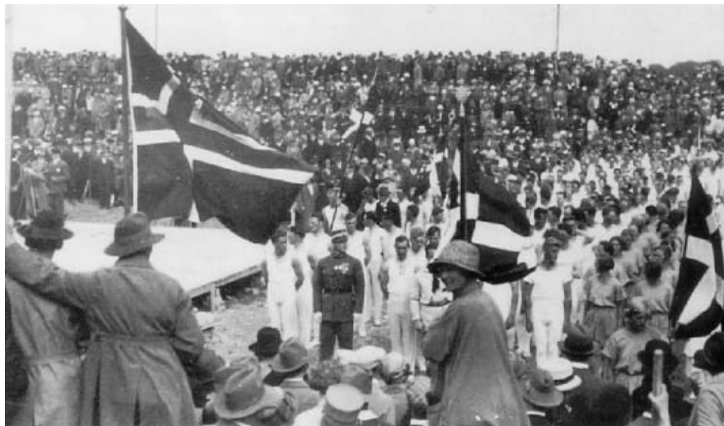
Dybbøl Skanser, hvor sønderjyderne i 1920 fejrede genforeningen. Stedets symbolværdi fik stor betydning for ungdomsarbejdet. Billedet viser gymnaster ved det store ungdomsstævne den 11. juni 1933.