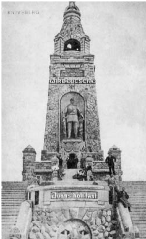
Det 45 m høje granittårn på Knivsbjerg. På foden af tårnet står turnernes valgsprog »Jungs holt fast«. Oven over kolossalstatuen af Bismarck et citat fra en af hans rigsdagstaler (1888) »Wir Deutsche fürchten Gott und sonst nichts auf der Welt«.

Turnbevægelsen bredte sig under aktiv medvirken fra Flensburger Turnerschaft til de tre af de større nordslesviske byer, Tønder, Åbenrå og Haderslev. I disse byer dannede tysksindede turnforeninger, der meldte sig ind i »Deutscher Turnerschaft«. 24 På denne måde kom turnbevægelse til at indgå som en vigtig bestanddel i bestræbelserne på at »fortyske« nordslesvig.