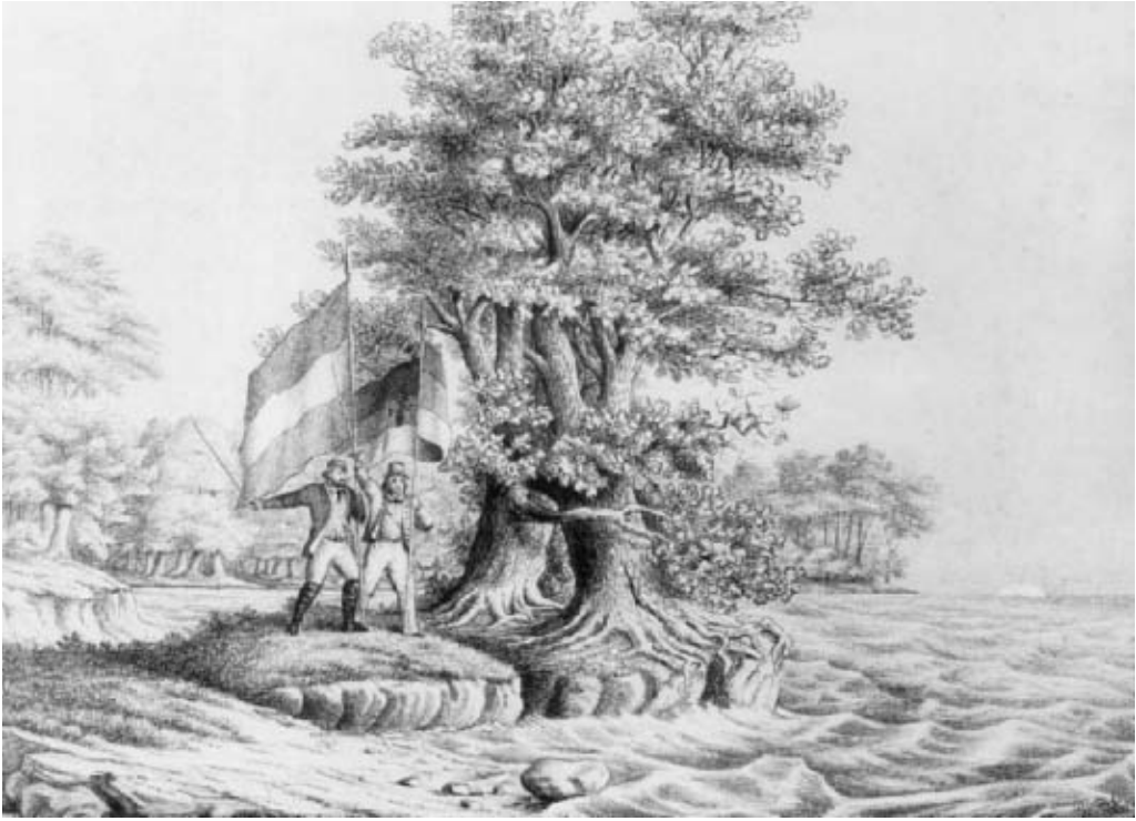
Illustration af Chemnitz' hymne »Schleswig-Holstein Meerumschlungen«. Illustrationen er overlæsset med symboler. Dobbeltgen – Slesvig-Holsten er uadskillelig. De to fanebærere der holder vagt viser henholdsvis studenten med det blå-hvid-røde Slesvig-Holsten-flag og turneren med den tyske enhedsbevægelses sort-rød-gyldne farver, i midten af fanen ses turnermærket: et kors dannet af 4 F'er: Frisch, fromm, froh, frei. Tegning i Schleswig-Holsteinisches Landesmuseum.

ren over Napoleon. I den anledning opnåede Sauermann den ære at blive hyldet som slesvig-holstensk frihedskæmper i krigen 1848-50. 22