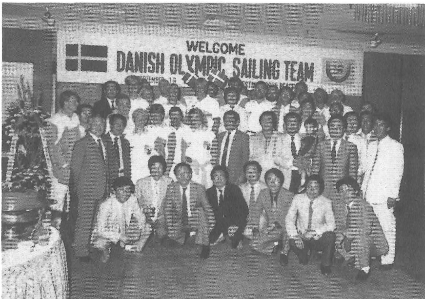
Det danske sejlerhold ved forolympiske lege i Pusan.

Alle svovlede da også. Man undrede sig over, at man havde valgt et så uegnet sted, og at så forkerte oplysninger om vejret var sendt ud. Om det første kom det frem, at inde i bugten ved Koreas Riviera er der stadig blæst, men ikke så høj sø. Selv fra de 15-16 etager høje hoteller, vi boede på, kunne man kun overse 2 af banerne i bugten. De to yderste baner havde ganske enkelt aldrig været brugt til andet end flådeøvelser og til kæmpecontainerskibe. Vejroplysningerne stammede fra lufthavnen, og den ligger inde i landet, hvor solen får vinden til at stige lige op i luften (fordi varm luft stiger opad). Denne luft erstattes så af køligere luft ude fra havet. Derfor blæser det konstant fra ved 10-11 tiden og til sidst på eftermiddagen med 12-14 m/sec, men kun ved kysten og nede ved havoverfladen. For flytrafikken er det imidlertid luftens fart forbi landingsbanen, der måles, og den er svag og opadstigende, fordi lufthavnen i forhold til havet ligger bag en bjergryg i bunden af en dal. Dette betyder, at de uhyre anlægsudgifter til havn og faciliteter er spildte. Efter OL-1988 bliver det meget, meget svært at få den internationale sejlsportselite til at komme til nye stævner i Pusan.