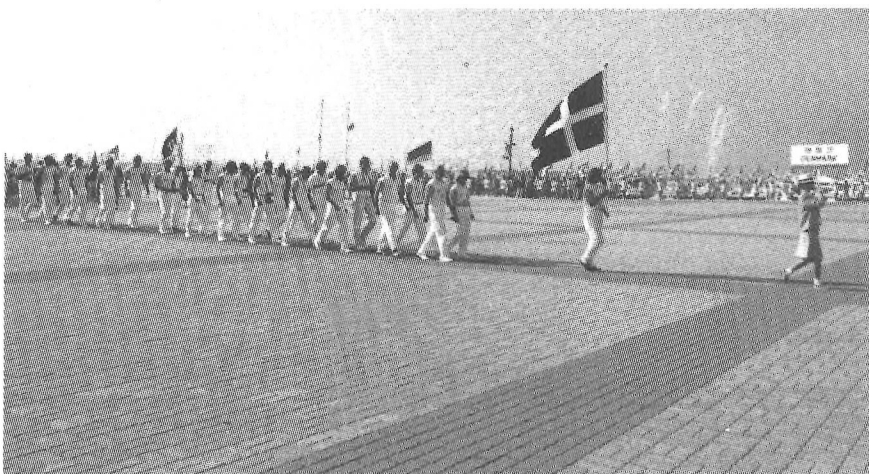
Det danske sejlerholds indmarch ved forolympiske sejladser i Pusan.

Da vi kom derud i 1987 med de to bedste danske besætninger fra næsten alle de otte klasser, blæste det igen fra 6-14 m/sek. Det gjordet det næsten hele den måned, vi var der. Kun i 2 dage var der 2-3 m/sek, i 4-5 dage blæste det i den øvre del af kulingstyrken (20-25 m/sec), og det var umuligt at tage ud. Til daglig var søen stejl og utrolig barsk, fra 4 til 7 meter høj. Kombineret med 100 m til havbunden og en konstant NØ-gående strøm på 2-4 knob (som ved Lillebæltsbroerne) bevirkede dette, at bøjerne, som danner rundingspunkterne, start og mållinjer, næsten ikke var til at få til at blive liggende. Det medførte ventetider, omsejladser, stress og mange sure miner. Dette forstærkedes af, at mange blev søsyge, og at alle havde det forkerte grej med, fordi de troede, de skulle ud at sejle i let luft. Forholdene på den yderste bane, der lå 6-8 sømil fra land, var til tider så barske, at det følte som decideret farligt af sejle på denne bane. Plannende både, som f.eks. Tornado'en, oplevede at flyve ud af 6-7 m høje bølger, fordi der ikke var noget vand på bagsiden. Dette ser flot ud, når det er et surfbrædt, men det er katastrofalt for en Tor-