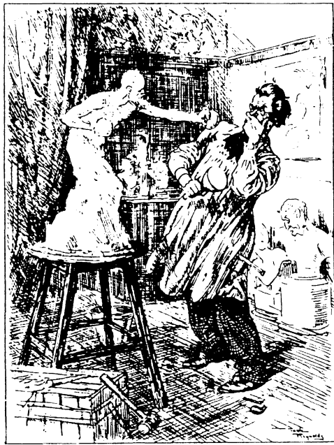
„Kunstnerrisiko“. Fra „Jul for Sportsmænd“ december 1935.

„Jul for Sportsmænd 1935“ hed også „Mr. Smiles Julenummer“. Mr. Smile var