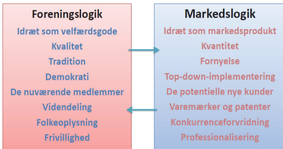
Figur 3. Idrættens dilemmaer og udfordringer

Der er således lagt op til, at foreningen som konstruktion og foreningslivet som sådan står over for en række nye udviklingstræk, der vil resultere i en række blandingstyper mht. ejerformer, retorisk legitimering samt idrætskultur. Nogle af disse foreninger vil i højere grad end tilfældet er i dag være præget af markedslogikken. Andre vil ikke. Således er ovenstående figur et forsøg på at skitsere denne mulige udvikling og ligeledes et forsøg på at optegne konturerne for en række centrale idrætspolitiske diskussioner. Disse bør også i høj grad iværksættes inden for den fremtidige sam-