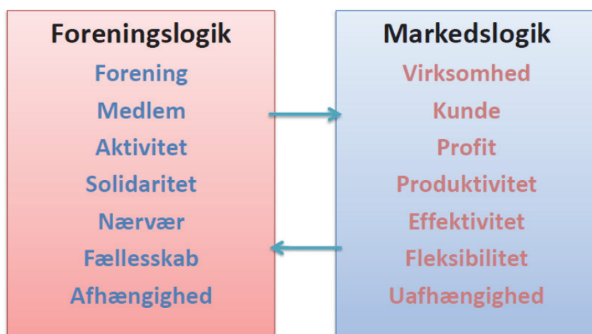
Figur 2. Foreningslogik vs. markedslogik

Tidligere var succes i foreningslivet således i højere grad præget af snakken om kvaliteten af de levede kulturbårne interessefællesskaber, som eksisterede i civilsamfundet uanset deres kommercielle potentialer. Hvis de bedste idrætsudbydere i fremtiden bliver målt på, hvem der har økonomisk succes eller ej, står vi med en relativt ny situation i breddeidrætten, hvor vilkårene for det, der opfattes som 'det gode foreningsliv', vil ændres markant.