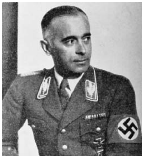
Rigssportsfører von Tschammer und Osten.