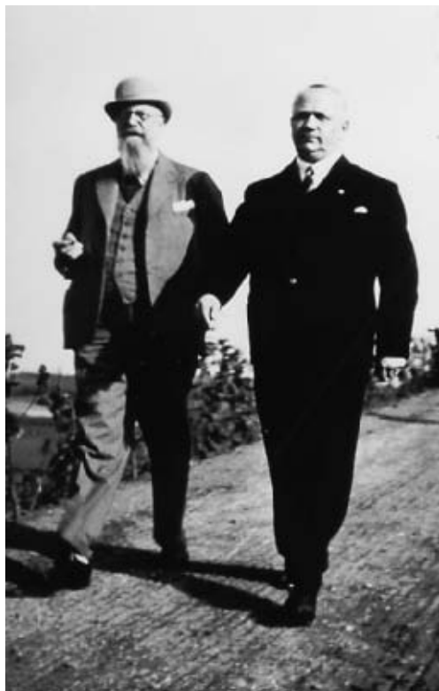
Stauning ved besøg på Gymnastikhøjskolen med udenlandske ministre i midten af 1930'erne. De to går ved siden af hinanden, uden at der spores nogen særlig kontakt. Bukh bragte først fotografiet i årsskriftet for 1950.

lers indflyvning til Nürnbergerpartidagene, som »Guden, der stiger ned fra himlen«. 55