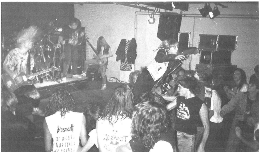
Desexult spiller til Rock Café. Bassisten var formand f. Rock Café gruppen. Bemærk den entusiastiske »stage-diver«.

bestemte tidspunkter. Mange er også i dårlig kondition, idet der ryges, drikkes og lalles for meget. Mange er dog alligevel i besiddelse af stor kropsbevidsthed og alle er meget interesserede i idrætsudfoldelse, så længe det kan ske på deres egne præmisser. Da de bevæger sig rundt i større eller mindre grupper, er det ofte at de stopper op og tager et slag fodbold eller andet, såfremt de møder en bold de kan hugge. Bemærkelsesværdigt nok, er disse unge i besiddelse af en udstrakt grad af social tankegang i forbindelse med idræt. De ændrer reglerne efter eget behov, er ikke-voldelige på banen og prioriterer det legende og det sjove i spillet. Er ikke underlagt noget konkurrenceprincip.