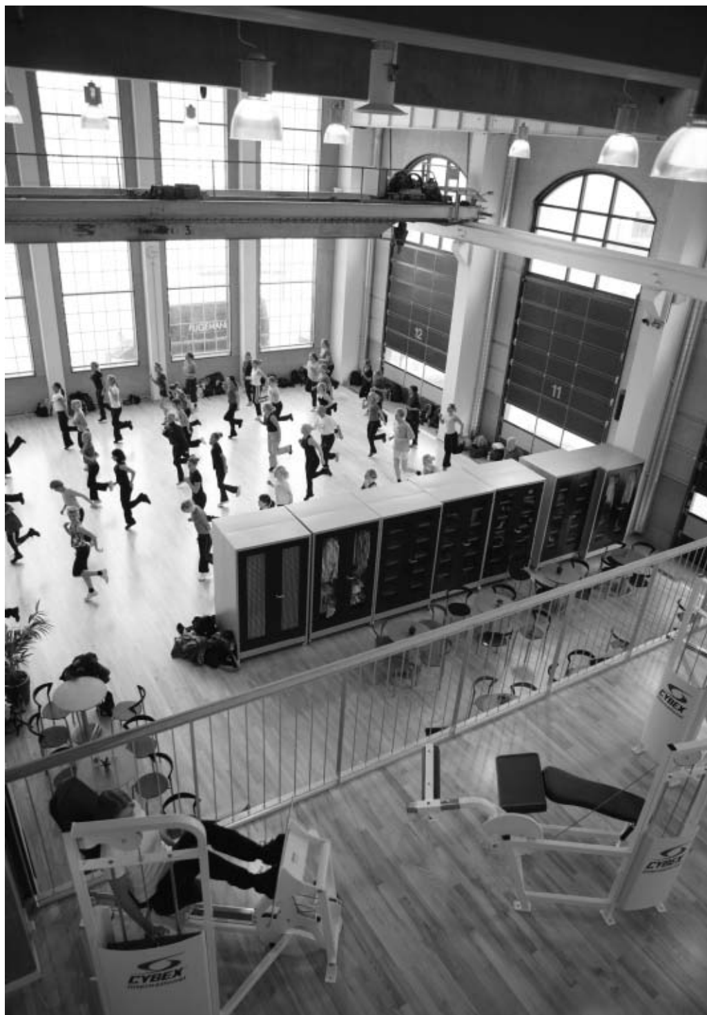
Styrketræningsområdet med udsigt ned i Hal D.