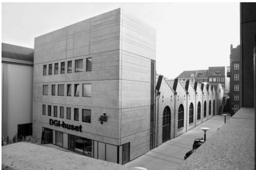
DGI-huset set fra Bruuns Galleri.

et topmoderne multiaktivitetshus med haller og rum til idræts- og kulturaktiviteter samt faciliteter til kurser, møder og administration... DGI-Århusegnen ønsker med huset at etablere et eksperimenterende og nyskabende idrætsmiljø, der drives i overensstemmelse med DGI-Århusegnens formål og som sådan medvirker til at sikre og synliggøre foreningens værdier. 48