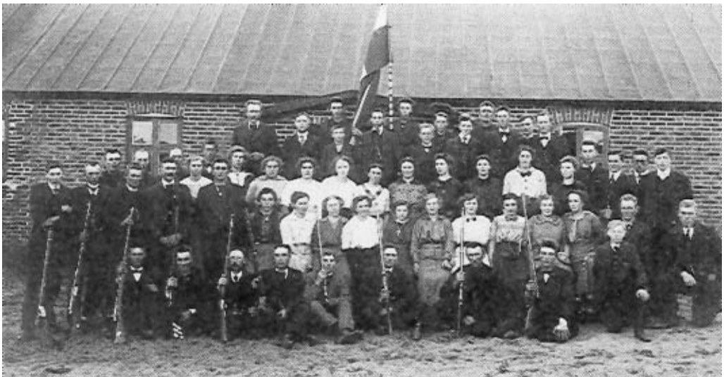
Medlemmer af Hover Skytteforening foran det første forsamlingshus.

Mange af de første forsamlingshuse i Danmark var bygget som »aktivisthuse«, opført af en kreds af ideologiske meningsfæller med grundtvigske og venstrepolitiske overbevisninger. 15 Senere blev forsamlingshusene fællesanliggender, hvor de ideologiske kampe begrænsede sig til at danne modpol til missionshuse (dog ikke i Hover) og til kampe om, hvor forsamlingshuset skulle placeres. At den politiske og den na-