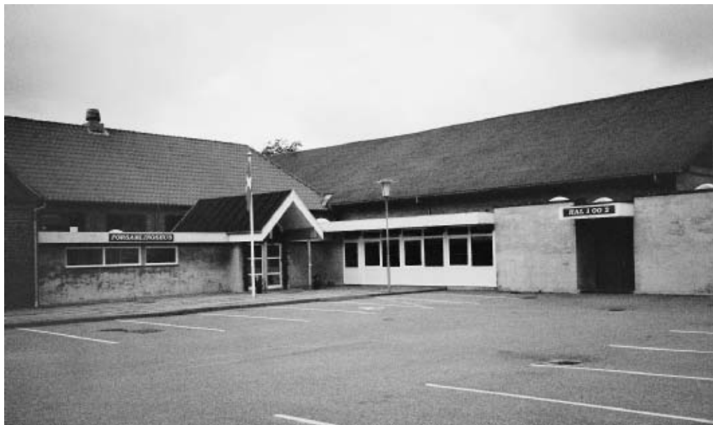
Sammenbygningen af forsamlingshuset og hallen i Højmark.

mødes i Højmark ved baller, som tidligere foregik rundt omkring i de forskellige sogne i forsamlingshuse, hvor der ofte ikke var spiritusudskænkning.