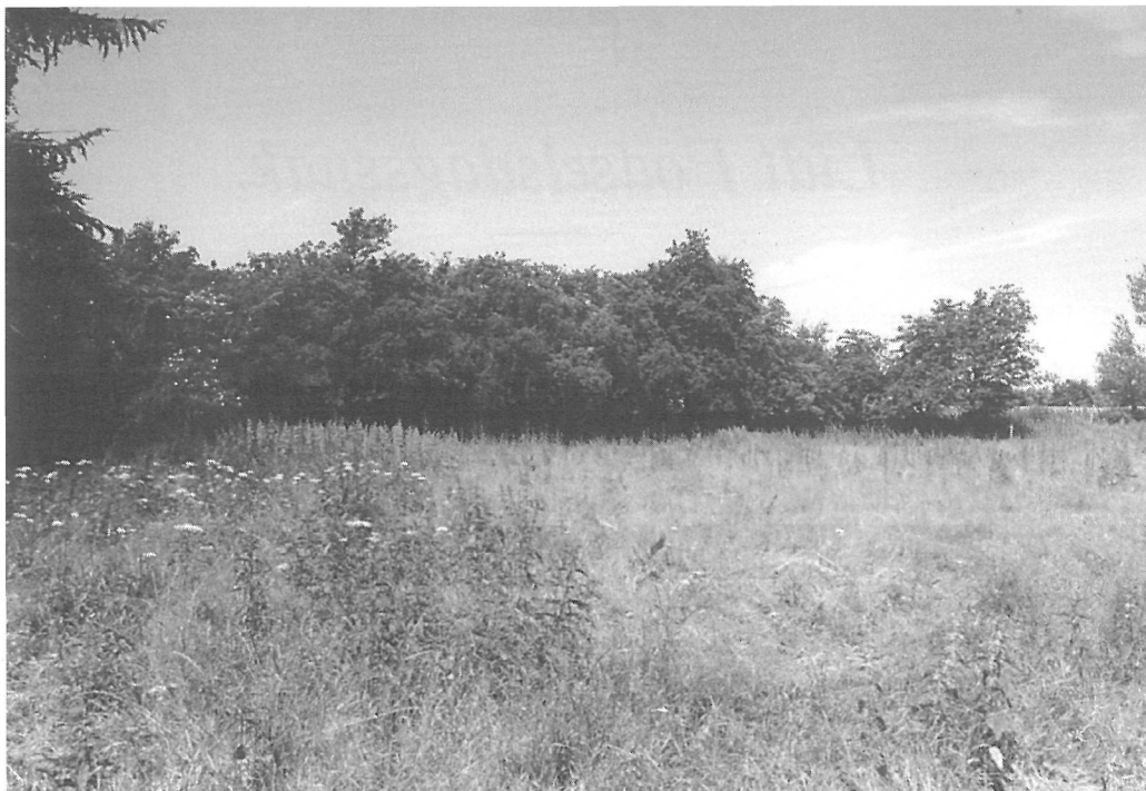
I Sdr. Vilstrup mellem Kolding og Fredericia lå håndboldbanen i denne indhegning placeret midt i landsbyen, klos op ad såvel skolen som forsamlingshuset og blev derved en organisk del af landsbylivet.

grænse-porøsitet mellem idrætsanlæg og lokalsamfundets sociale virkelighed vist sig at være en vigtig faktor, sådan som det fremgår af ovennævnte eksempler: jo mere indelukket og territorielt præget det pågældende idrætsanlæg fremtræder, desto mindre gennemslagskraft har det socialt, medens det omvendte også gør sig gældende.