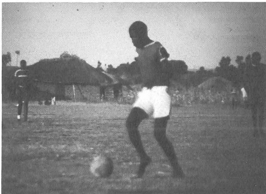
Fra kampen i Nyanguge

Tilbage i tiden var alle menneskene delt op i forskellige aldersgrupper, som hver havde deres specielle dans til at identificere dem, hver havde deres opgave og funktion. I tidens løb udviklede dette system sig til, at unge mænd og kvinder organiserede sig i forskellige arbejdsfællesskaber – for at få arbejdet gjort hurtigere og nyde det sociale samvær. Disse fællesskaber blev kaldt dansegrupper, fordi hver gruppe havde en dans, der identificerede den. Grupper med samme arbejdsform og med samme oprindelse i deres dans, havde organiseret sig i 'selskaber', dvs. store foreninger, som dækkede hele landet. Der var to af disse store, landsdækkende selskaber: BAGIKA og BAGALU. Overalt hvor de mødtes til festivaler og lignende konkurrerede grupper fra disse to store selskaber om, hvem der var den mest populære. De udfordrede hinanden til dansekonkurrence. Den vindende her var den, der trak de fleste tilskuere. Situationen med at dansegrupper fra forskellige landsbyer konkurrerede indbyrdes svarer til situationen hvor fodboldhold fra hver sin landsby spiller kamp mod hinanden. I hver dansegrube var der et bestemt bevægelsesmønster for hver dans og en danseleder, der bestemte. Dette skabte en stor grad af samhørighed og fællesskab inden for gruppen. Det samme kan opleves på et fodboldhold, hvor hele holdet – i gudbenådede