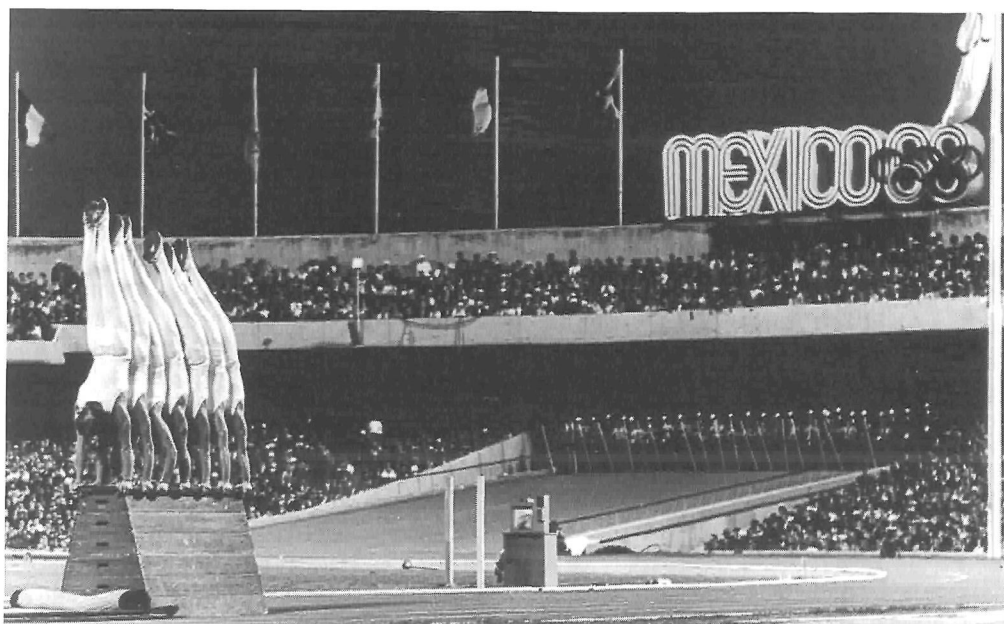
Et af Danish Gym Teams højdepunkter under afslutningsceremonien ved de Olympiske Lege i Mexico 1968.

Følgende 24 lande er besøgt en enkelt gang: Cuba, Tahiti, Ceylon, Grækenland, Indien, Pakistan, Israel, Guatemala, El Salvador, Martinique, Barbados, Surinam, Brasilien, Uruquay, Argentina, Chile, Peru, Equador, Colombia, Venezuela, Indonesien, Kina, Japan, Korea