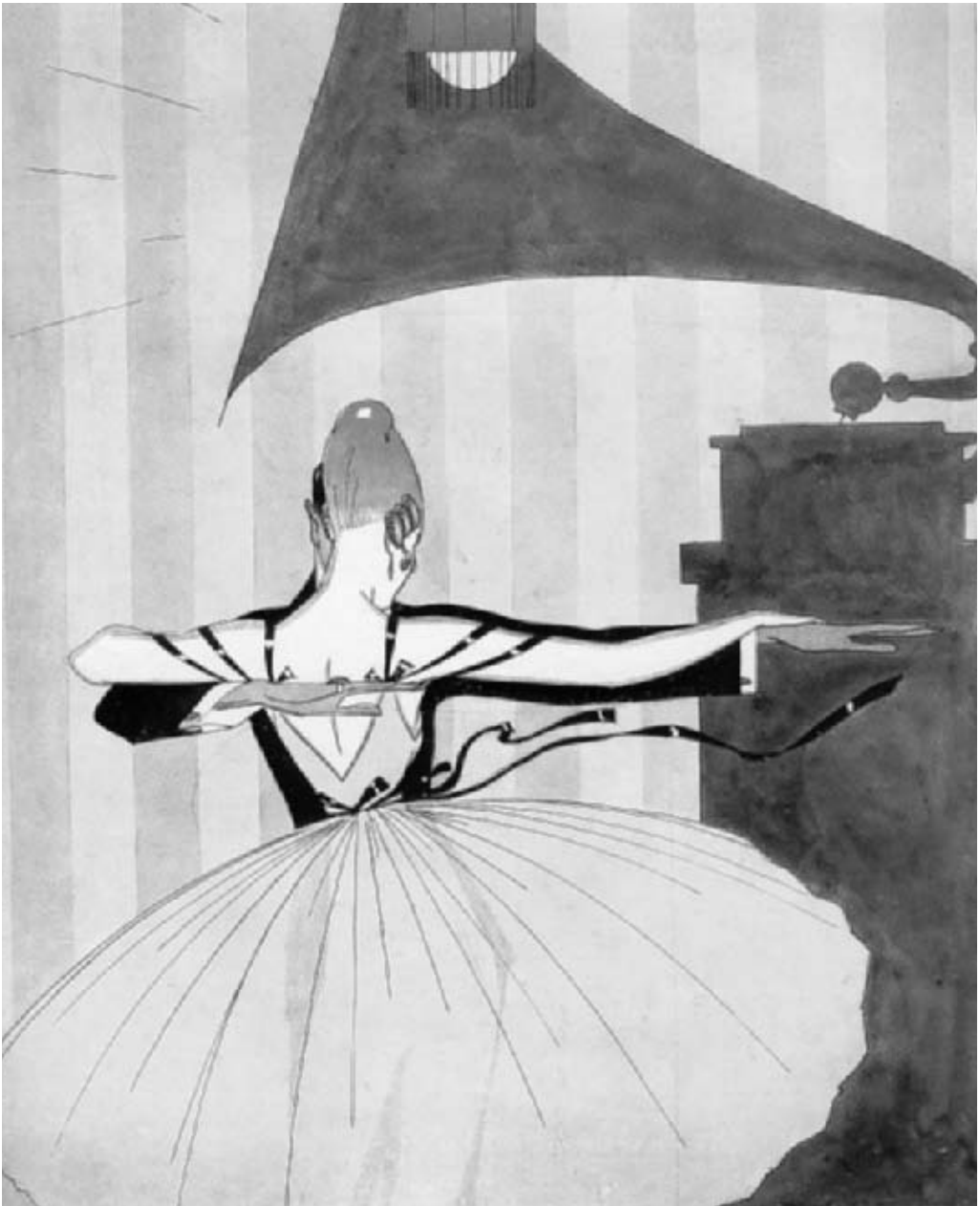
Den moderne dans til grammofoonmusik (tegning af Sven Brasch i Vore Herrer, 15. juni, 1916).

og i Sverige. Nu kom turen til Danmark. 59 Den samlede presse var på tærne, og i Politiken blev det forestående balletbesøg