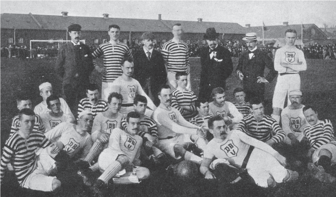
Dansk fodbold tog form i slutningen af 1800-tallet med spredte initiativer fordelt over hele landet. 21 sjællandske og fem jyske klubber oprettede i 1889 Dansk Boldspil Union, og et hovedformål med skabelsen af DBU var at skabe bedre vilkår for fodboldspillet. Med andre ord at gøre opmærksom på fodboldens sag i forhold til politikere. Her ses et udvalgt DBU-hold mod skotske Queens Park i 1898.