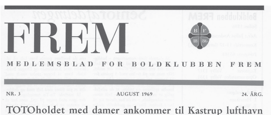
TOTOholdet med damer ankommer til Kastrup lufthavn

teriet blev emellertid inte enbart ett alternativ till traditionellt statsbidrag. Med idrottslotteriet skapades nämligen de ekonomiska förutsättningarna för Stockholm att arrangera 1912 års Olympiska spel, inklusive anläggandet av det monumentala byggnadsverket Olympiastadion. Och de stora svenska framgångarna vid »solskens-olympiaden« fick därefter avgörande betydelse för att riksdagen sedermera övergav sin tidigare så negativa attityd till idrottsverksamhet. Med början 1913 fick idrottsrörelsen följaktligen sitt anslag. Därmed spelade spelmarknaden åtminstone indirekt en viktig roll för att idrottsrörelsen kom i åtnjutande av ett permanent och årligt offentligt stöd.