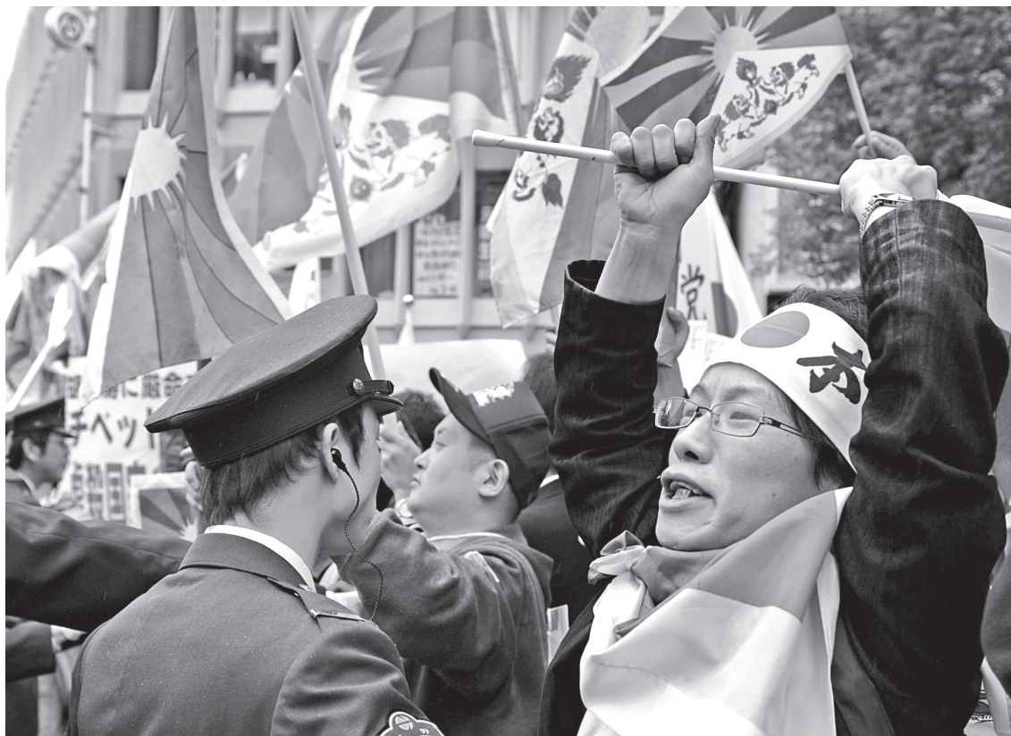
Ordensmagten kontrollerer pro-tibetanske demonstranter i forbindelse med den olympiske fakkelstafet gennem Nagano den 26. april 2008. Ifølge vidner endte denne japanske del af fakkelstafetten i et fire timers voldsomt slagsmål, hvor fire mennesker kom til skade.

gen før OL: »I think really there was an attempt to avoid promising anything, rather than an attempt to make promises. That human right groups have been saying China made promises, I think that's wishful thinking. I understand why they're doing that – it's a political strategy. But I am a social scientist, and from that perspective, that's just not true« (Badger, 2008). Som man kan se af referencerne, er det små ukendte me-