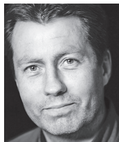
AF HANS BONDE

hvor sporten blev brugt som forbindelsesled til og propagandamiddel over for omverdenen. Denne vending blev især effektueret ved Hitlers beslutning af 16. marts 1933 om at fastholde Berlin som arrangør af 1936-legene (Krüger & Murray, 2003, s. 28).