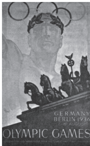
Olympisk plakatskulptur. Et arisk overmenneske med glorie understøttet af militære stridskræfter inkarneret i Brandenburger Tors firspann (King & McGow, UK).

I Weimarperioden havde det tyske nazistparti ingen egentlig sportsafdeling, men Sturm Abteilung (SA) var det nærmeste, partiet kom en sådan, især i perioder, hvor der var mindre brug for aktiv gadekamp. Nazistpartiet og især SA var præget af en »völkisch« tankeverden, hvor ethvert folk skulle udtrykke sin kropskulturelle egenart, men i forbindelse med OL i Amsterdam i 1928 og i Los Angeles i 1932 åbnedes øjnene for de tyske sejres propagandaværdi. Efter den nazistiske magtovertagelse kæmpede SA for maksimal indflydelse på sportens organisering i Det tredje Rige. Når den nazistiske ledelse valgte ikke at give efter for det völkische pres, skyldtes det et valg af en internationalistisk linje,