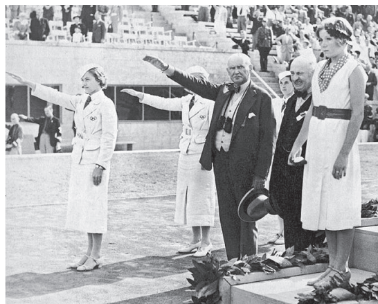
Dette hyppigt bragte billede er efter befrielsen blevet et ikon på dansk modstand mod den tyske propaganda. Som danskerne så sig selv med tilbagevirkende kraft (Krarup, 1989)

Goebbels' propagandaministerium fik udarbejdet en rapport om opfattelser af De Olympiske Lege i den udenlandske presse. Hvad Danmark angik, faldt særligt holdningerne til OL hos den »venstreorienterede presse anført af regeringsorganet« Socialdemokraten ministeriet for brystet. Set med nazisternes øjne faldt So-