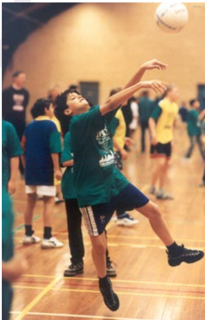
Dansk Volleyball Forbund fik 'forbund i fokus'-prisen 2004 med henblik på at markedsføre kidsvolley. Det er Idrættens Medieudvalg, der uddeler prisen.