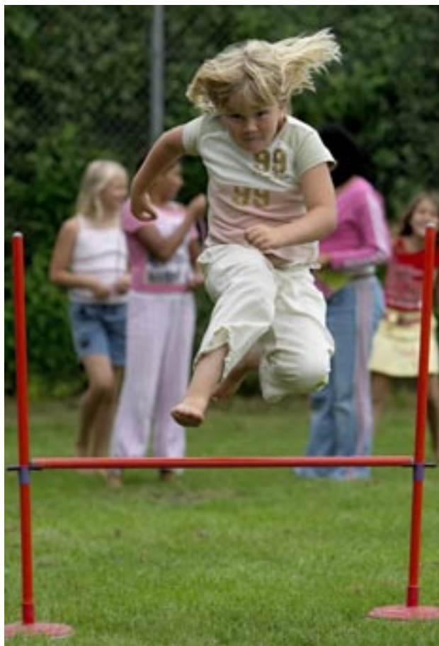
Skolesport i fuldt firspring.

Idégrundlaget for en idrætsbørnehave er, at idræt, leg og bevægelse indgår som en naturlig del af institutionens hverdag og den pædagogiske praksis. Idræt, leg og bevægelse bliver en integreret del af børnenes hverdag og tager udgangspunkt i, at børnene får udviklet de forudsætninger, som er nødvendige for at de kan mestre de udfordringer, som livet byder dem.