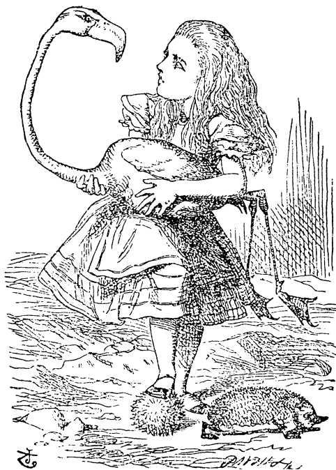
Alice, Kølle og Kugle.

har hun også svømmet rundt i sine egne tårer. Dronnten foreslår derfor at de skal tørre sig i dette Caucus Race. »What is a Caucus-race?« said Alice. »Why«, said the Dodo, »the best way to explain it is to do it«. Derefter lavede Dronnten en slags cirkel, men som Dronnten forklarer, er den præcise form af mindre betydning. Alice og dyrene placeres indenfor, og uden at der tælles til start begynder deltagerne at løbe rundt (de startede heller ikke fra noget bestemt sted). Dyrene holdt op at løbe, når det passede dem, og ingen kunne rigtigt sige, hvornår konkurrencen var slut. Efter megen tænken erklærede Dronnten, at alle havde vundet, og at alle skulle have præmier. 5