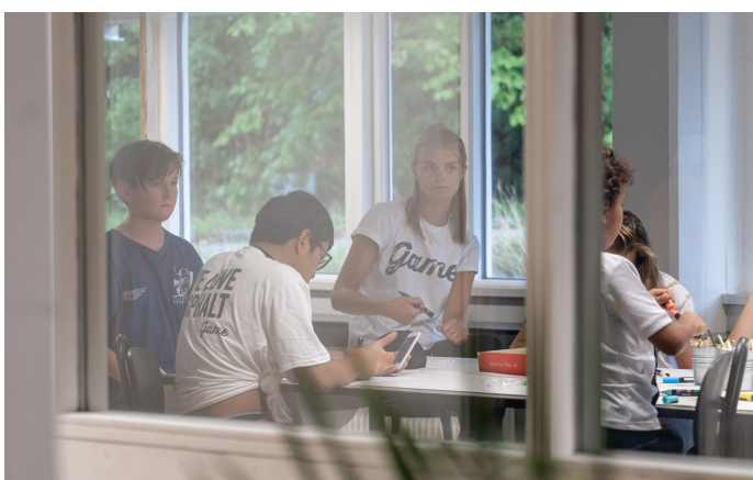
I GAME Streetmekka Aalborg er det kreative streetart lokale placeret et stykke væk fra zoner, hvor de højintense aktiviteter finder sted. Lokalet er delvist aflukket med kig til facilitetens indgang og det loungeområde, der støder op til lokalet. Her er det sociale i centrum.