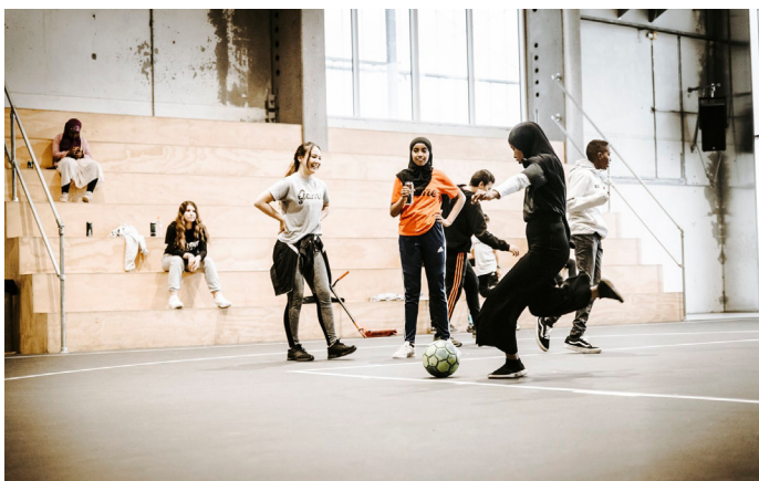
Trappen i GAME Streetmekka Viborg muliggør, at brugerne kan trække sig lidt tilbage og holde en pause samtidig med, at et overblik over og udsyn til de igangværende aktiviteter bevares.