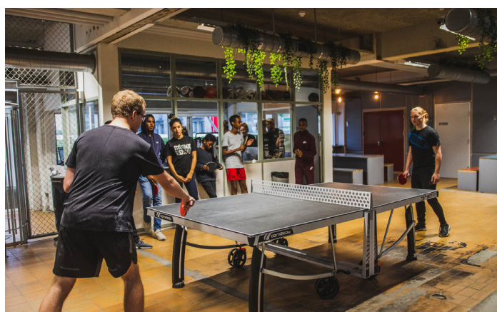
Når brugerne ankommer til GAME Streetmekka Aalborg træder de ind i loungeområdet, hvor der er bordtennis, mulighed for fællesspisning og sofaer til afslapning. Området er dedikeret til det sociale samvær.