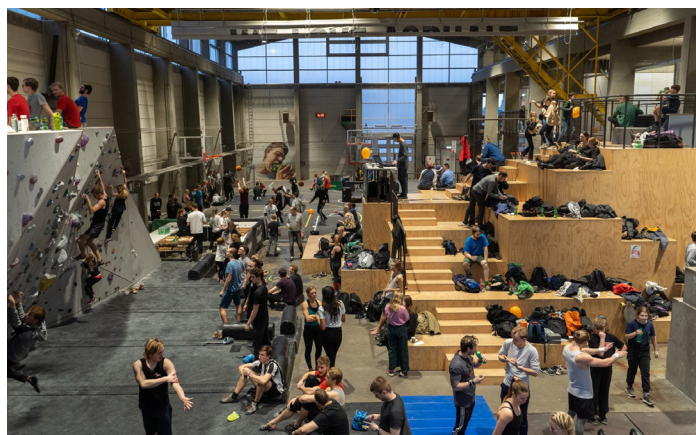
Det store trapelement centralt placeret i den stor hal i GAME Streetmekka Aalborg kan benyttes til ophold, pause og samvær i mindre eller større grupper. Herfra kan man se husets øvrige aktiviteter.