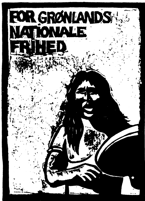
Trommedans som politisk identitetsmærke. Plakat fra 1982.

Anderledes står det til i Nordamerika, hvor Northern Games, World Eskimo Indian Olympics og andre konkurrencer balancerer hårfint mellem inuittisk kulturfest og sportiv turnering. Der konkurreres man i forskellige traditionelle aktiviteter, som kan tænkes at blive sportificeret, d.v.s. streamlined gennem kvantificering: højde-fodstød med en fod eller med to fødder, kano-kapronning og hundeslæde-væddeløb. Ved andre motoriske aktiviteter bliver sportificeringen vanskeligere: skindhop, piskeknalden og tovtrækning (som det jo også i vestlig sammenhæng, efter nogle forsøg frem til 1920, mislykkedes at olympisere). Og andre aktiviteter, som også dyrkes om kap, unddrager sig gennem deres kul-