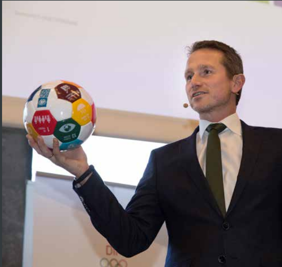
Finansminister Kristian Jensen holdt tale på DIF18