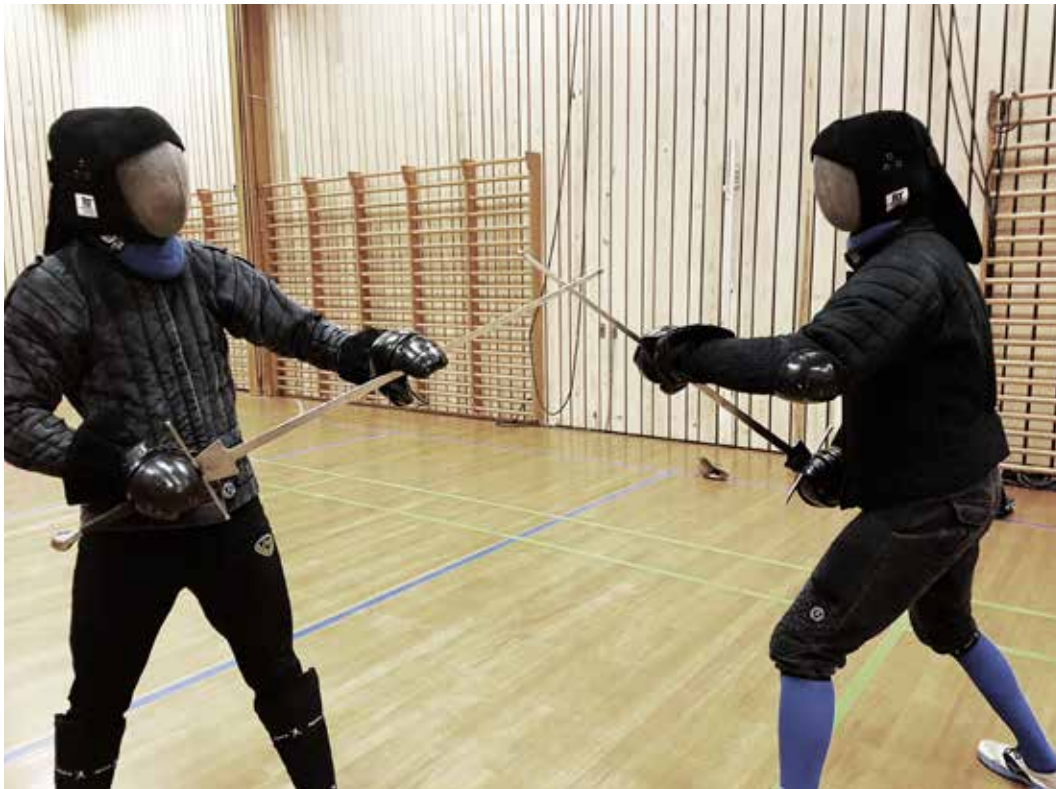
Fire klubber med Historical European Martial Arts på programmet blev optaget i fægteforbundet i 2018

De kommende år vil afsløre, om de to indsatsår sammen med en række andre initiativer i fægteforbundet har båret frugt og givet mere idræt for penge.