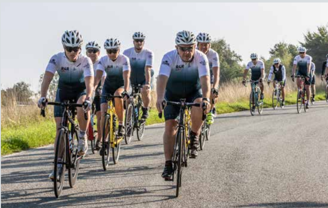
Statsminister Lars Løkke Rasmussen var med i feltet, da 45 skadede krigsveteraner fra DIF Soldaterprojekt kørte Ride4rehab

"Vi opfandt for syv år siden DIF Soldaterprojekt, fordi vi synes, vi skylder veteranerne en masse, og fordi vi har en stor tro på, at fysisk aktivitet og fællesskaber gennem idrætten virker. Vi er meget stolte af de resultater, vi har haft i DIF Soldaterprojekt."