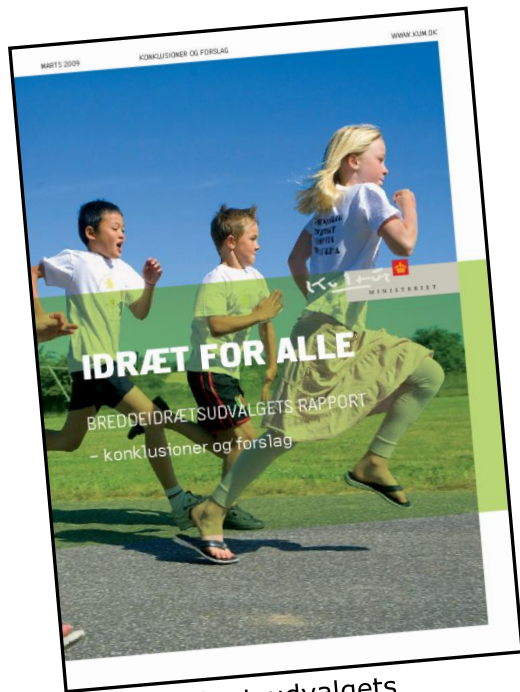
Breddeidrætsudvalgets rapport, 2009