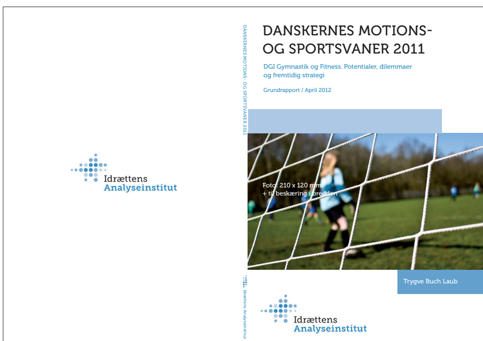
Omslag med ryg og bagside