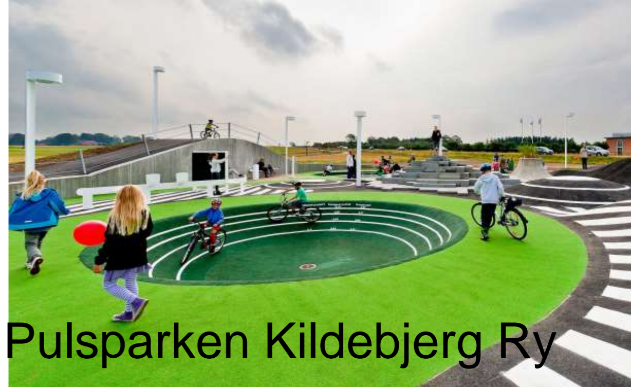
Pulsparken Kildebjerg Ry