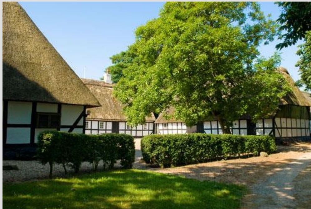
Viggo Mortensen