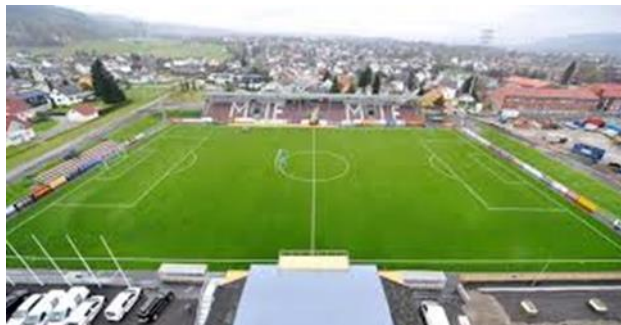
Mjøndalen IF, 1. divisjon, 4.350