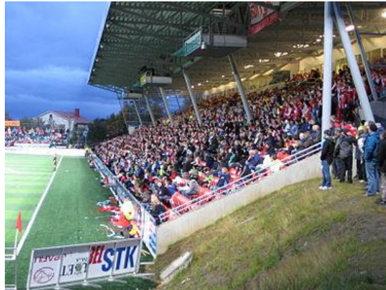
Tromsø, Tippeligaen, 7.500