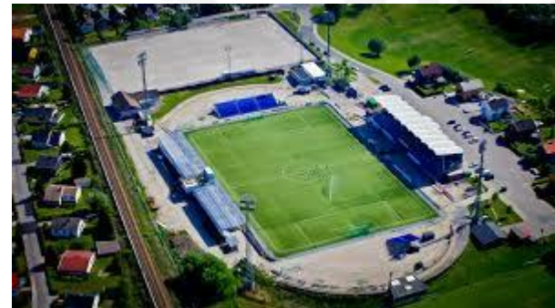
Sarpsborg 08, Tippeligaen, 4.700