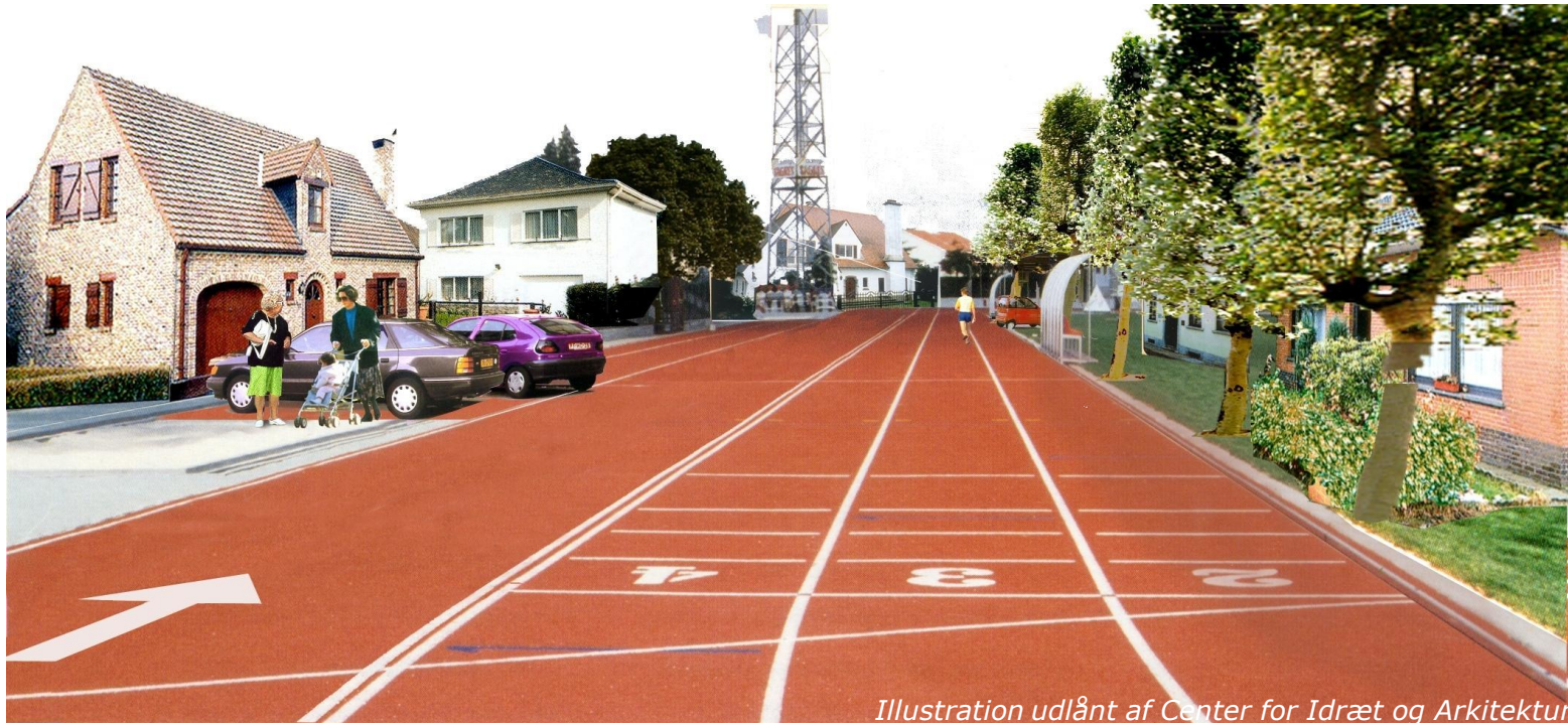
Illustration udlånt af Center for Idræt og Arkitektur